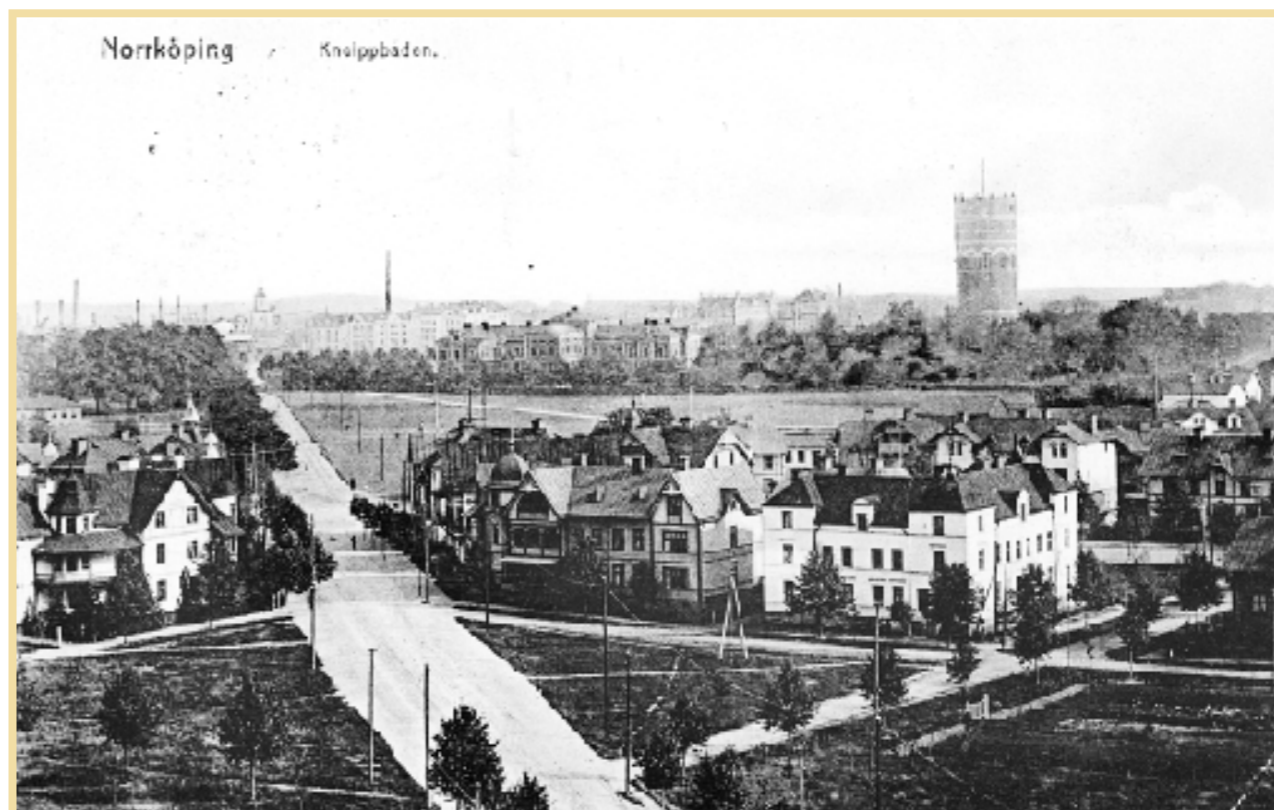
En vy från tornet på Hultet i mot staden Norrköping. Till höger kvarteret Oxen med Villa Fridhem, vilket först fungerade som pensionat, sedan som municipalsamhällets kommunalkontor. Till vänster Villa Sunhill, dagens ICA Kneippen. Bebyggelsen i kvarteret Oxen har fått ge plats åt moderna villor och radhus.

”Kring kuranstalten växte ett litet samhälle upp och sakta, men säkert, byggdes det villor längs dåvarande Strandvägen, dagens Kneippgatan och Trafikgatan, dagens Borgsgatan.”