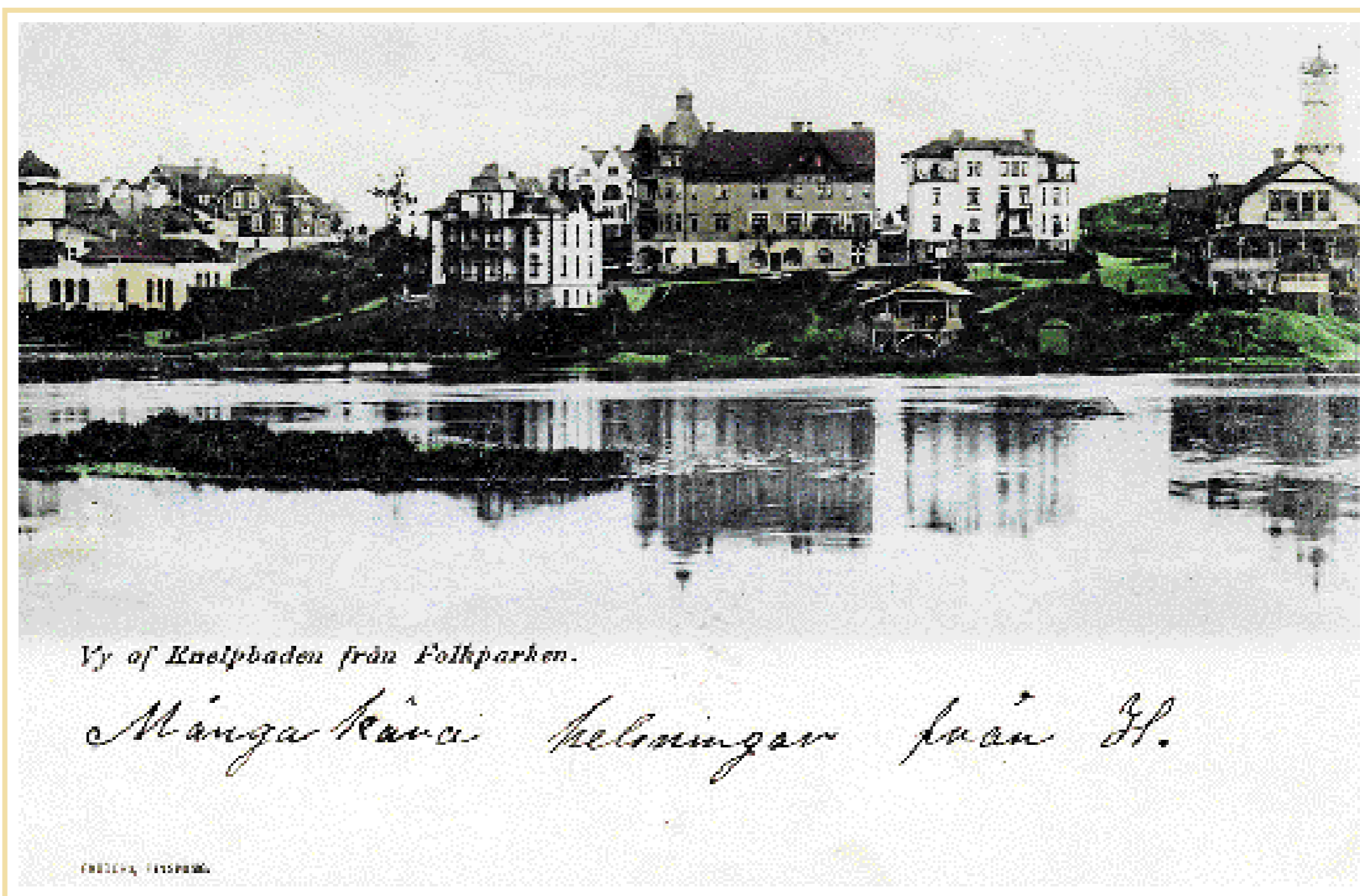
Vy of Kneippbadens från Folkparken.

”Kring kuranstalten växte ett litet samhälle upp och sakta, men säkert, byggdes det villor längs dåvarande Strandvägen, dagens Kneippgatan och Trafikgatan, dagens Borgsgatan.”