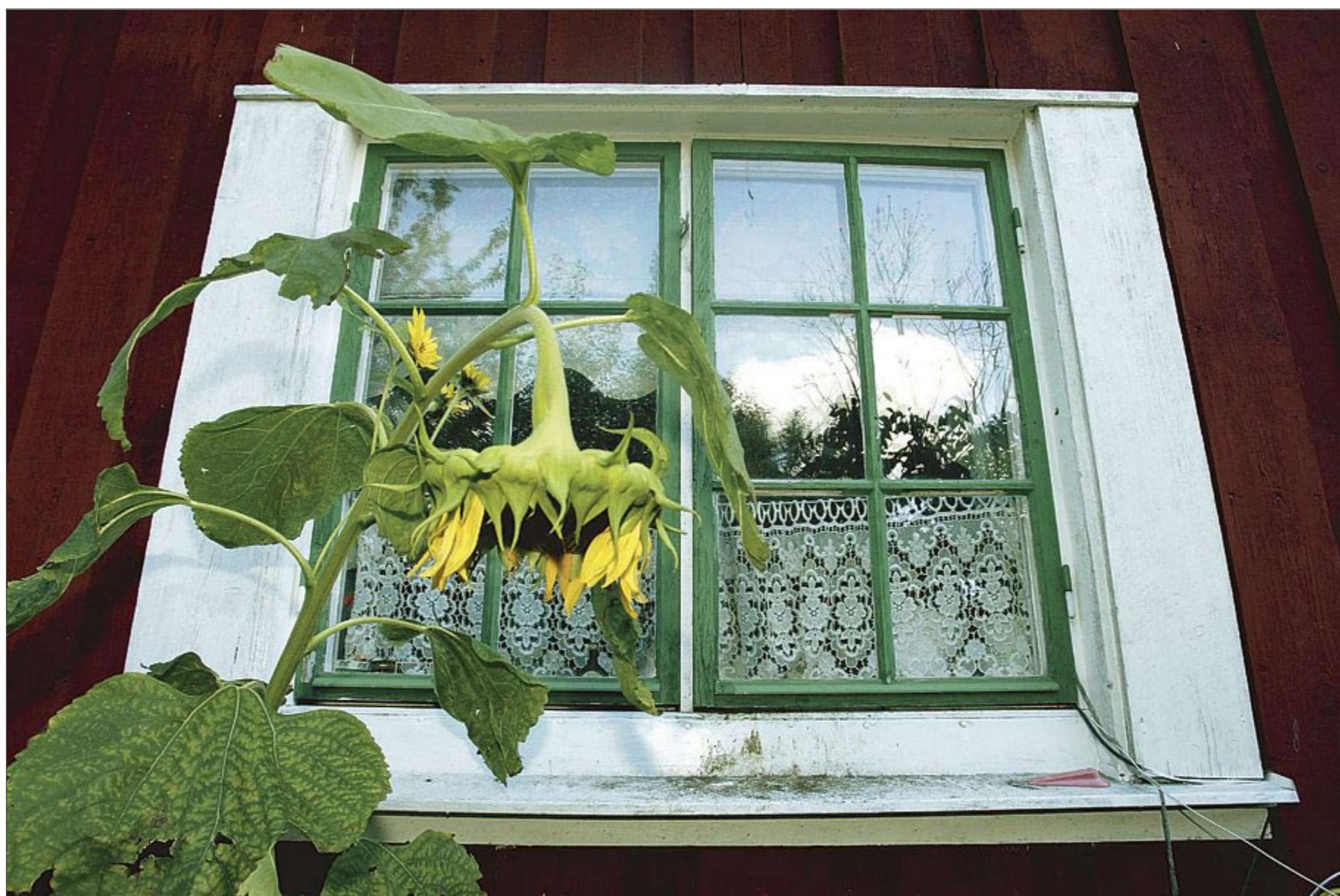
En idyll som ska bevaras. Den nya detaljplanen innebär bland annat att det införs rivningsförbud i Röda Stan.