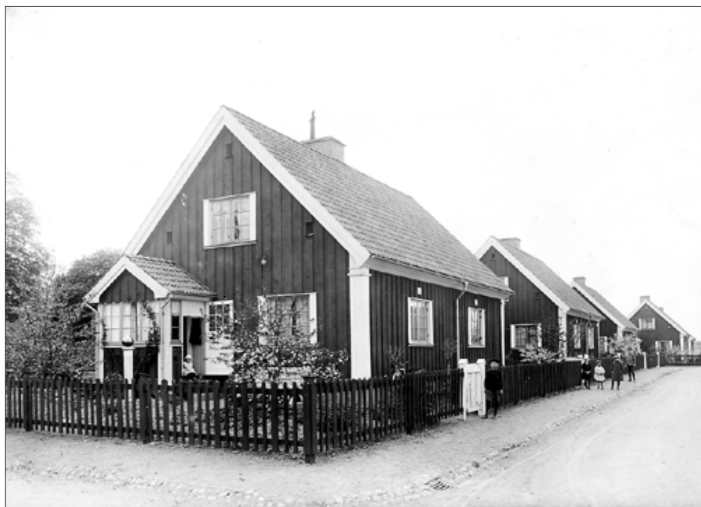
Husen i Röda Stan ritades av arkitekten S E Lundqvist i fyra olika typer. Alla i trä och med plats för en, två eller flera familjer.