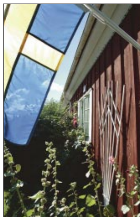
Röda Stan har av någon betecknats som ett monument över nationalromantikens röda stugor med vita knutar.