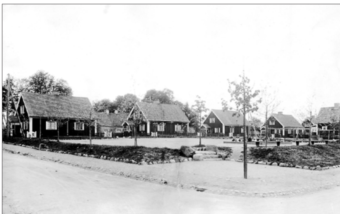
De nya bostäderna uppfördes vid Porsgärdet, ett område som ingick i köpet av Marielunds gård.