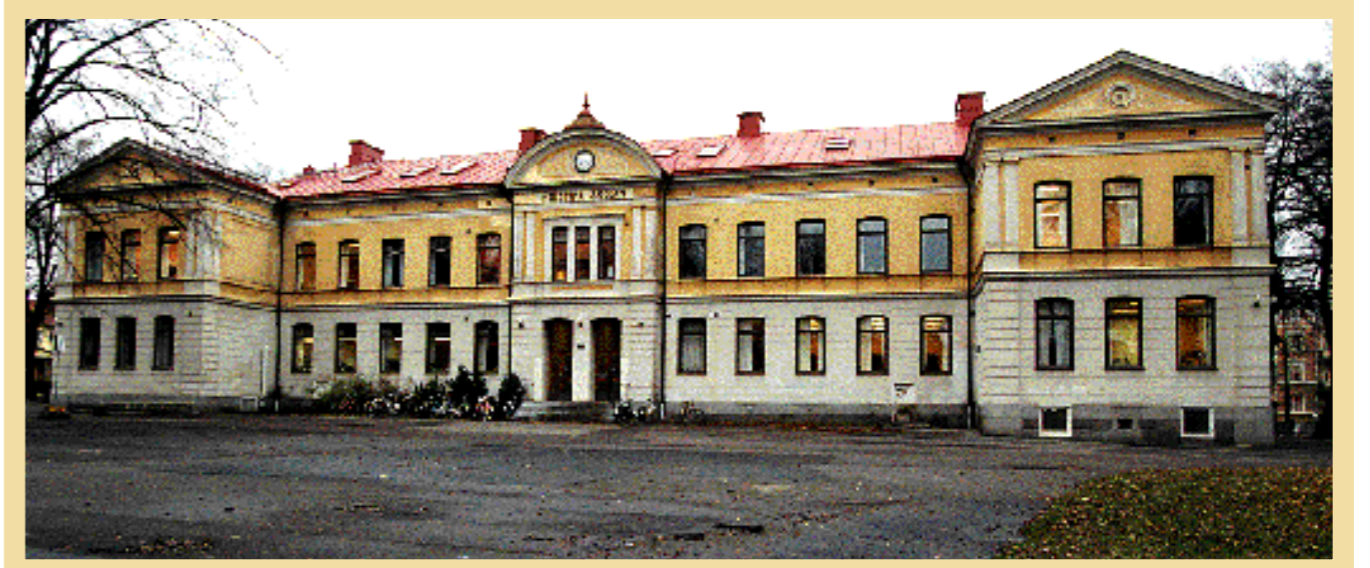
Kristinaskolan. När folkskolestadgan var ett faktum fanns det ett behov av skolhus. Och förutom Kristinaskolan bär Malm ansvaret för flera av Norrköpings skolbyggnader.