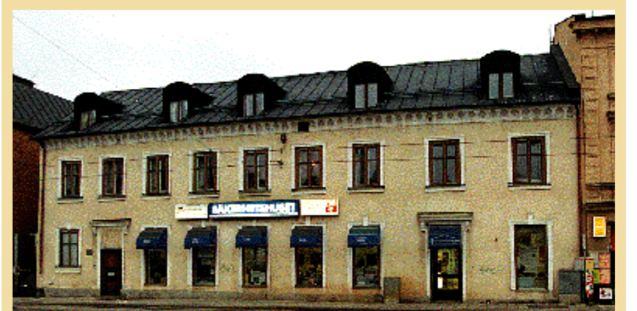
Den tidigare krogen Kronan, som senare förvandlades till Restaurang Capri. På 70-talet var Capri synonymt med fullt ös och hit gick det unga Norrköping för att svinga en bägre