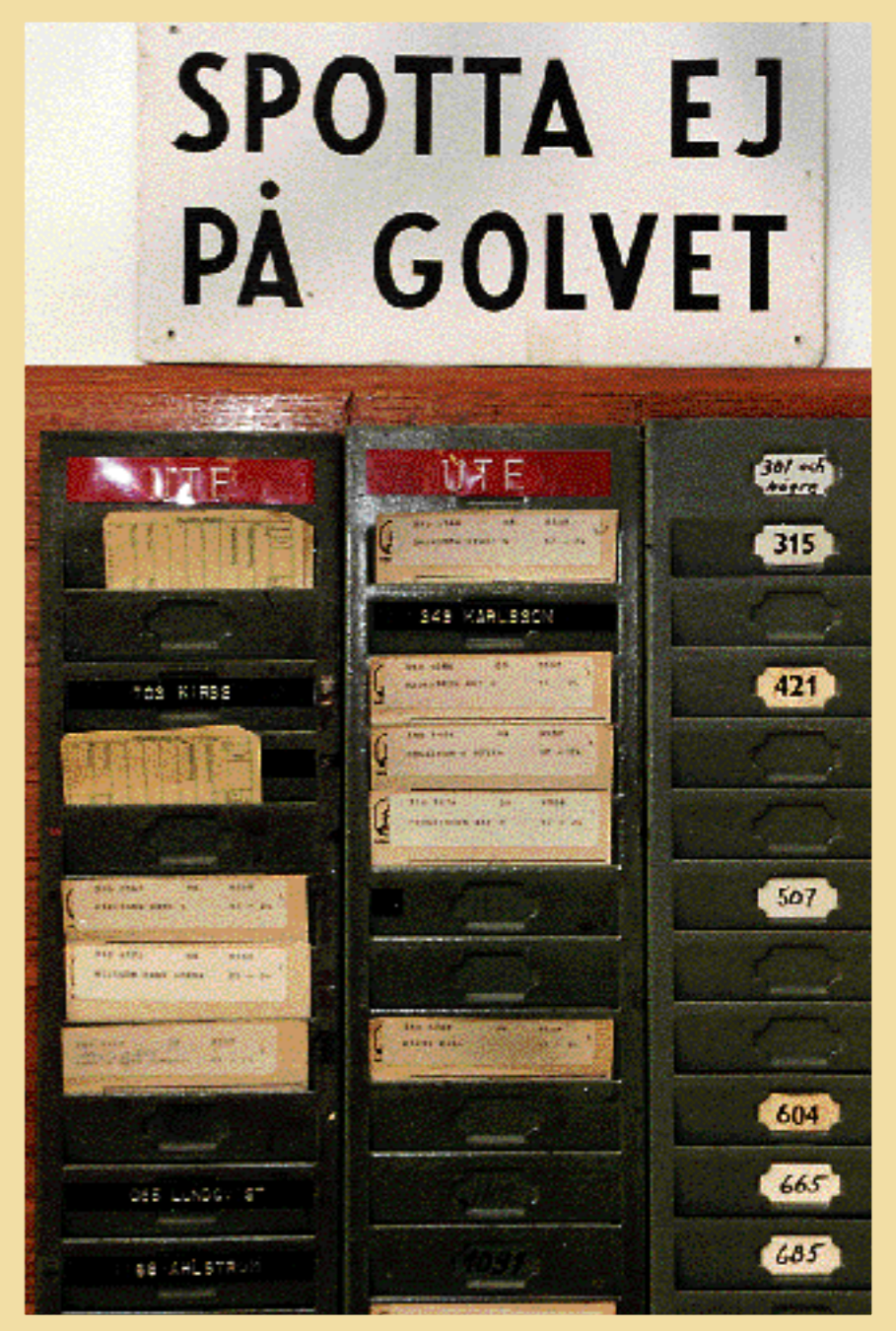
En skylt som säger allt om gamla tiders fabriksmiljöer.

Med hjälpmedel som kyplåda, form och så kallad däckel förvandlar Holmenveteranerna massan till färdiga