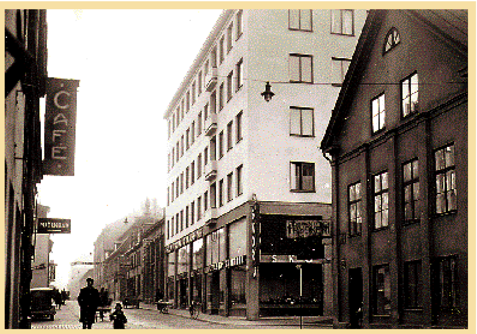
En bild från tidigt 40-tal som visar kvarteret Gäsens omgivning söderut. Centrichuset i sin funktisstil är det dominerande inslaget.