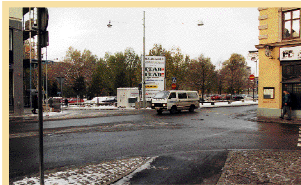
Nu. När rivningen väl var genomförd körde bilarna in. Ännu ett exempel på en parkeringsplats som stadsbild i Norrköpings innerstad.