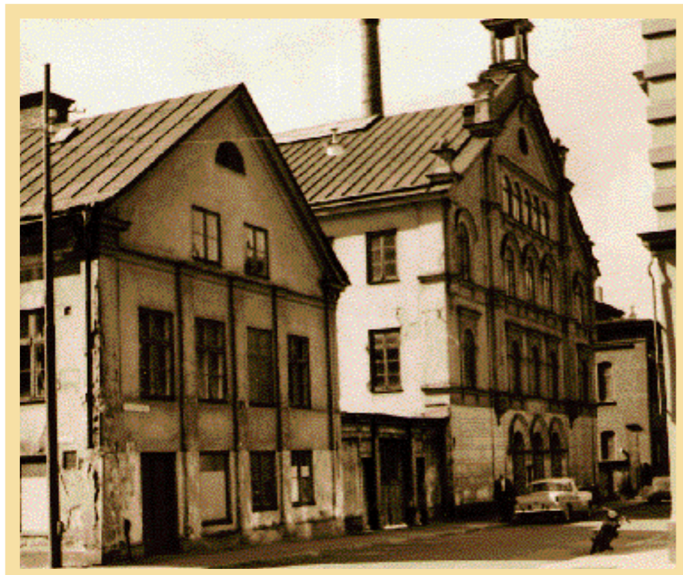
Då. Den gamla Immanuelskyrkans entréfront ut mot Gamla Rådstugugatan. Den kyrkliga verksamheten upphörde 1956 och i mitten av 60-talet revs hela kvarteret. Skorstenen i bakgrunden tillhör gamla badhuset.