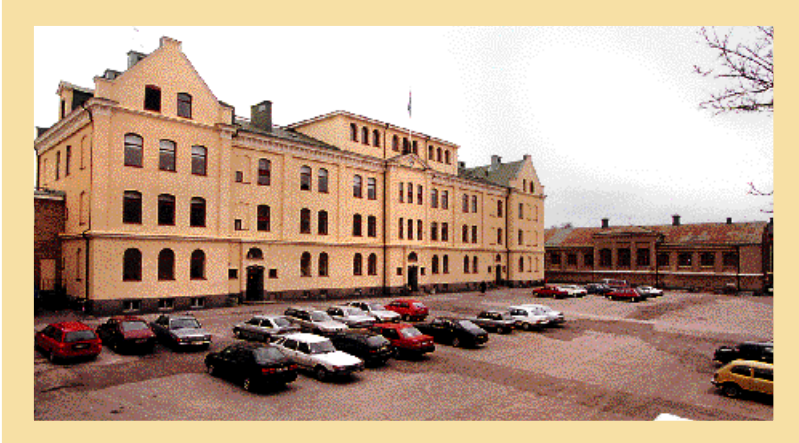
Källvindsskolan fungerar idag som lokaler för Komvux. Fasaderna har slåtats ut och de karaktäristiska dragen är borta för alltid.