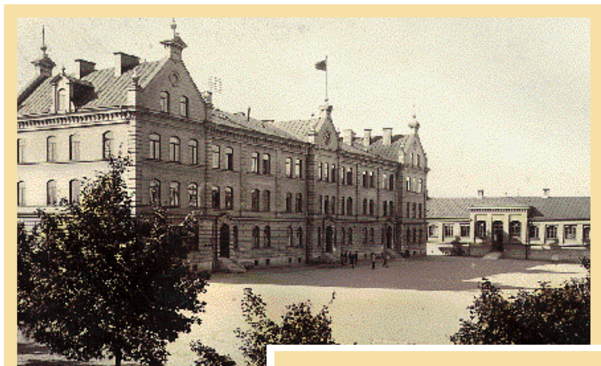
Militärskolan lades ned 1926 och omvandlades i stället till Kommunala mellanskolan. Både kasernhus och gymnastiksal har dock byggts om under årens lopp och därmed förlorat de ursprungliga dragen.