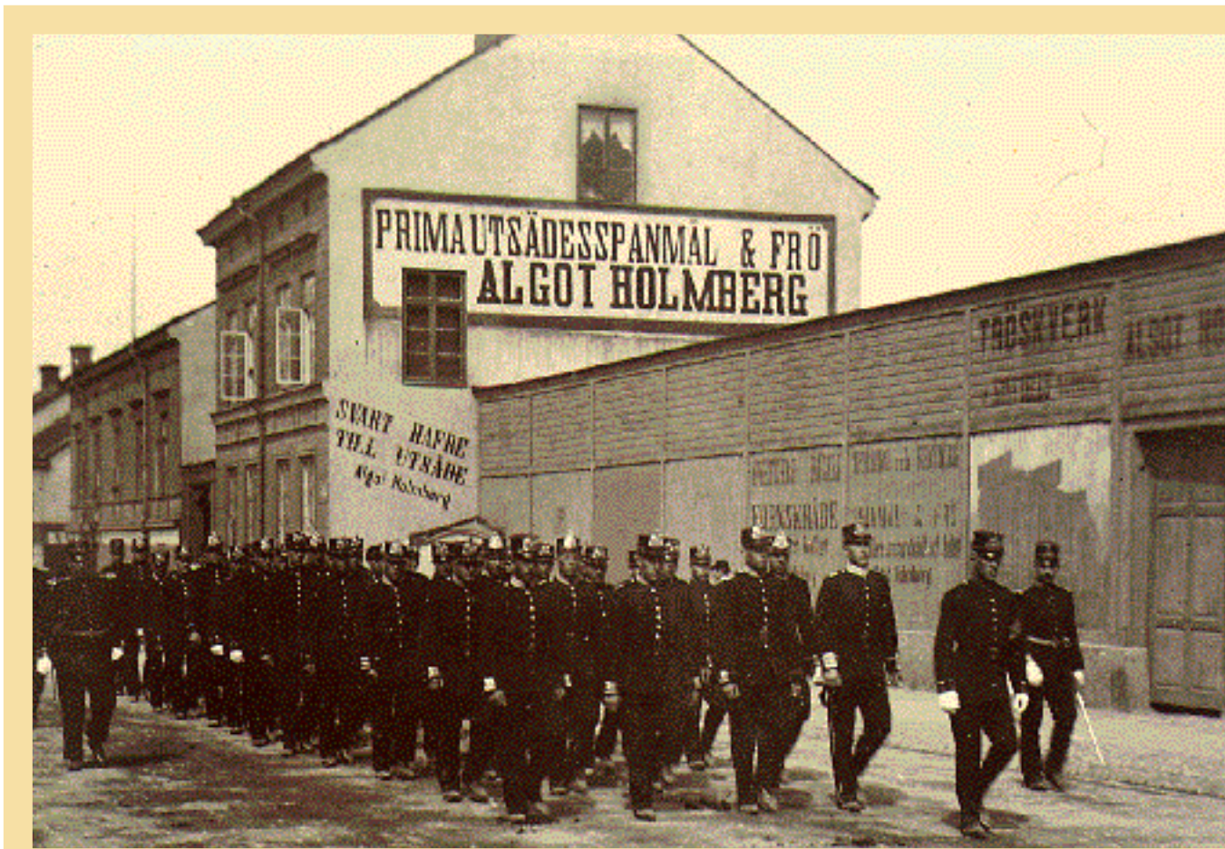
Militärskolans rekryter ute på drill, en inte ovanlig syn i stadsbilden.