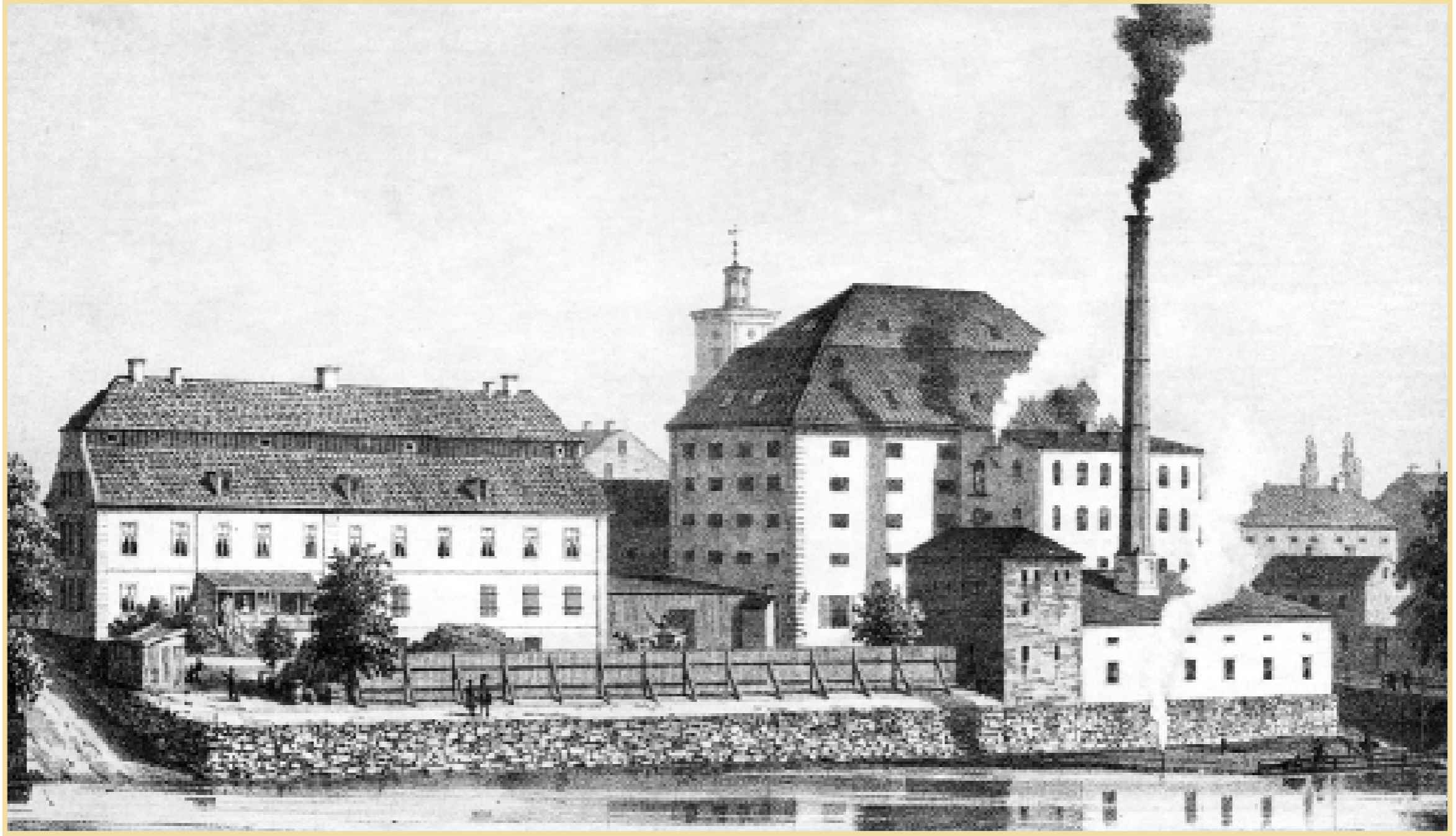
Sockerbruket Gripen, sett från Strömmen på en gravyr från 1800-talet. Huset till vänster är