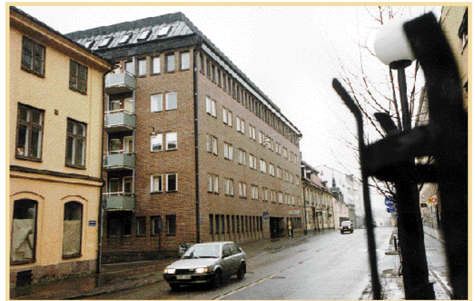
Samma hörn idag. Det hus som ersatte Gripen var det kontorshus, vilket uppfördes till Televerket. Idag är här studentbostäder.

borgmästaren, Olof Ekerman. En av de två sockermästarna kom från Holland och råsockret importerades från Holland och Portugal. I slutet av 1700-talet hade Gripen fått