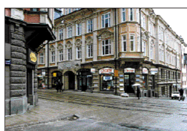
FRÅGA 3 = X Kvarteret Gripen

De tre först öppnade rätta lösningarna har skickats in av: