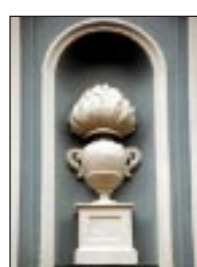
FRÅGA 1 = 2 Drottninggatan