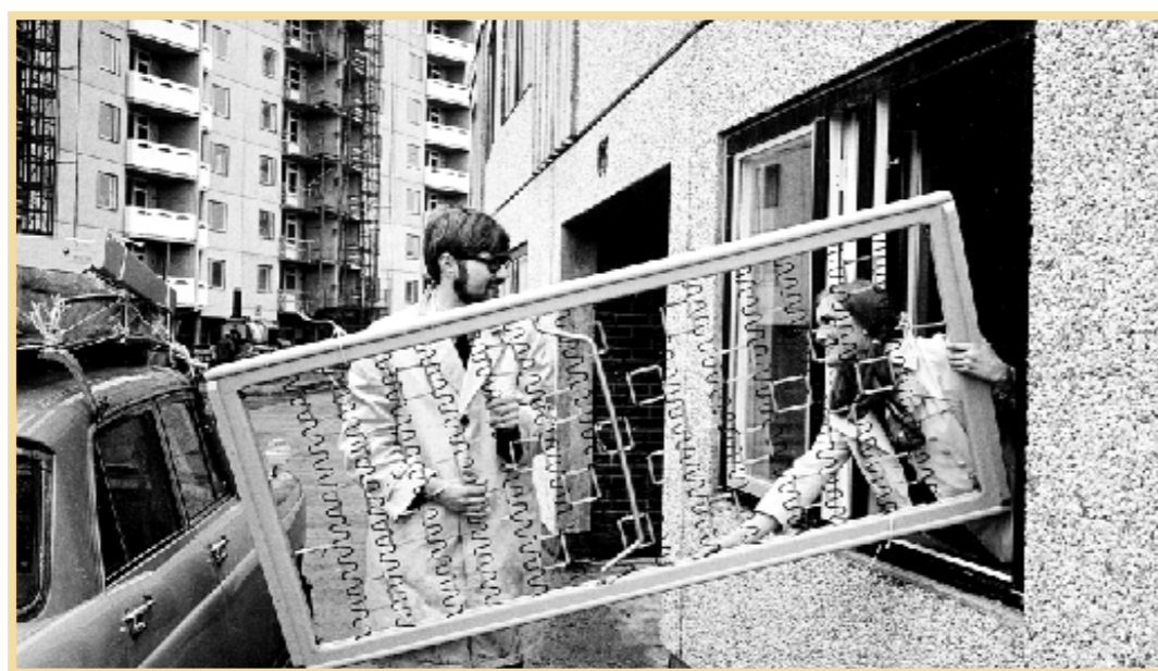
April 1969. Guldringen är fortfarande en stor byggarbetsplats, men nu anlände de första hyresgästerna.