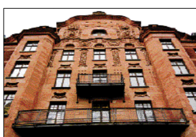
FRÅGA 2 = X Bankpalatset