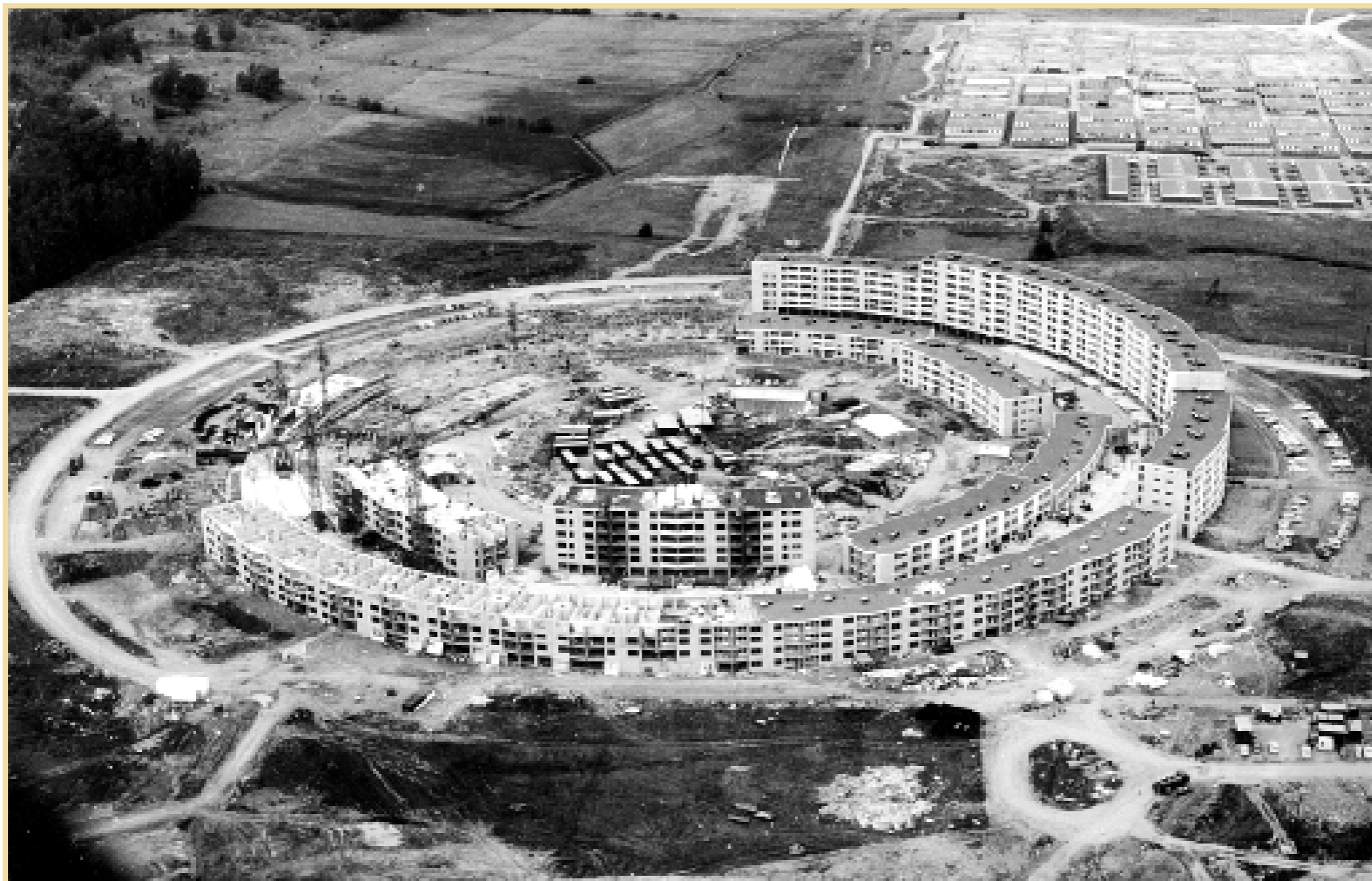
September 1969. Cirkeln håller på att slutas för Guldringen, den första av de båda ringarna i Navestad. I mitten ses atriumhusen och därefter södra Hageby.

Vi ger er även svaren och vinnarna i vår frågetävling, samtidigt som vi säger tack och hej för den här säsongen. Stolta Stad gör ett sommaruppehåll och återkommer i slutet av augusti.