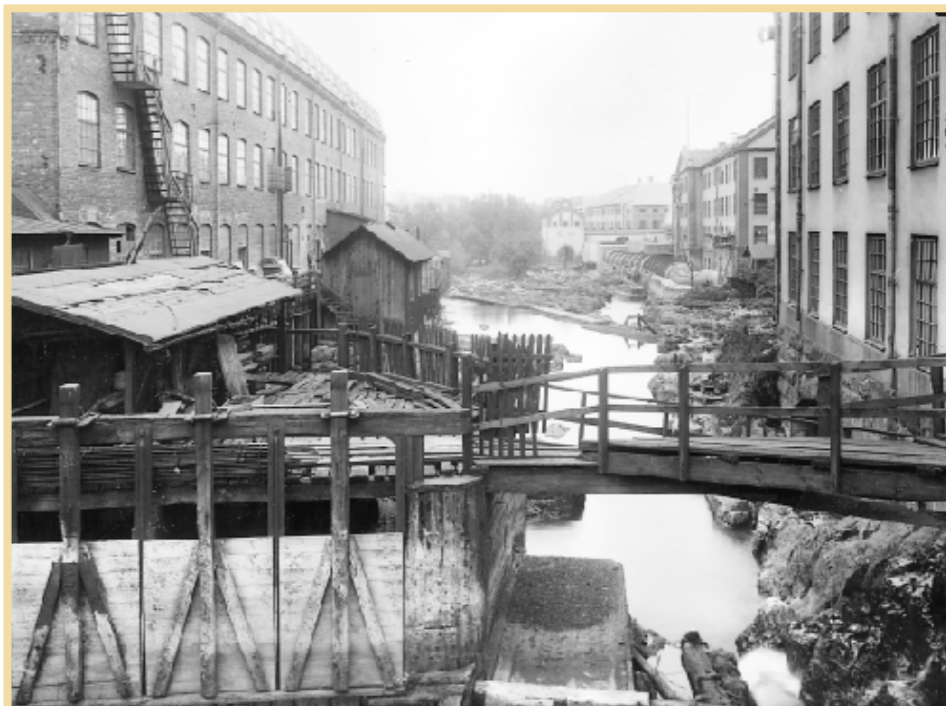
En bild från dåtidens Holmbron, ned mot Bomullsspinneriet och Holmens pappersbruk. Den nya kraftstationen Bergsbron-Havet innebar att stora delar av Strömmen tuktades.