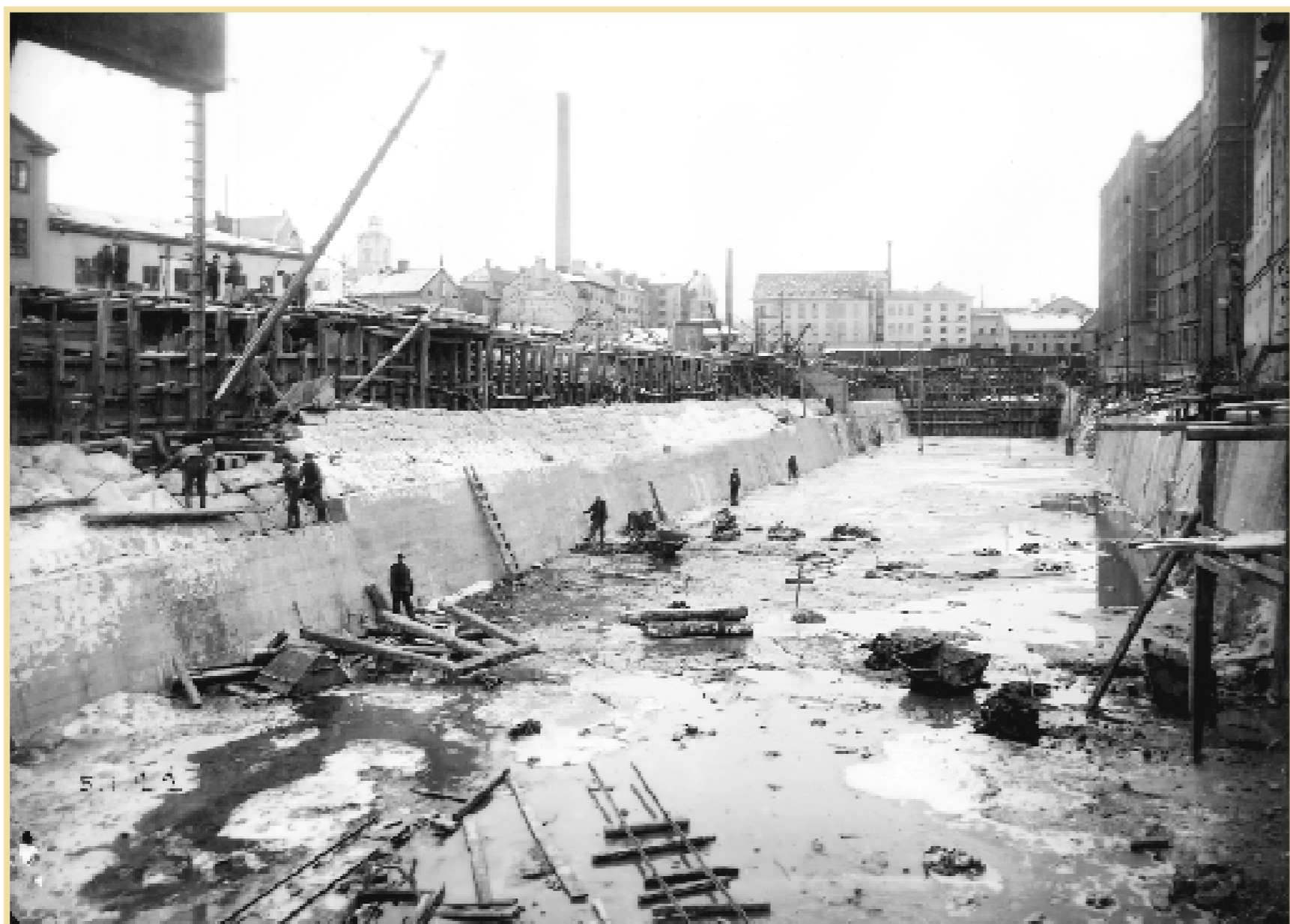
Inför den nya kraftstationen Bergsbron-Havet utsattes Strömmen för en omfattande reglering. Som här, nedströms Gamlabro, där den mäktiga strömfåran har fyllts igen. Och staden begåvades med en ny park. I bakgrundens mitt skimtar det Swartziska verket och till vänster, gamla sockerbruket Gripen. Till höger skimtar Nyborgs Yllefabrik.

D agens Stolta Stad ser tillbaka på den period på 1920-talet när Strömmen, stadens pulsåder, utsattes för en reglering av sällan skådat slag. Det är samtidigt dags för en ny omgång i vår frågetävling.