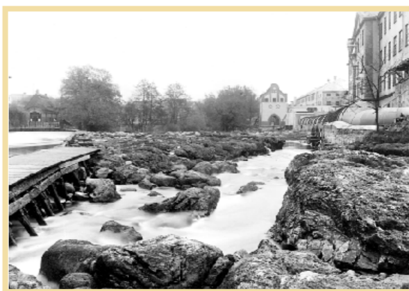
Den urgamla, men torrlagda strömfåran under ombyggnaden. Den som så ofta hade avbildats på litografier och målningar. Till vänster ses Långåsens kraftstation, till höger Bomullsspinneriet och Kråholmens kraftstation. I och med regleringen försvann den gamla