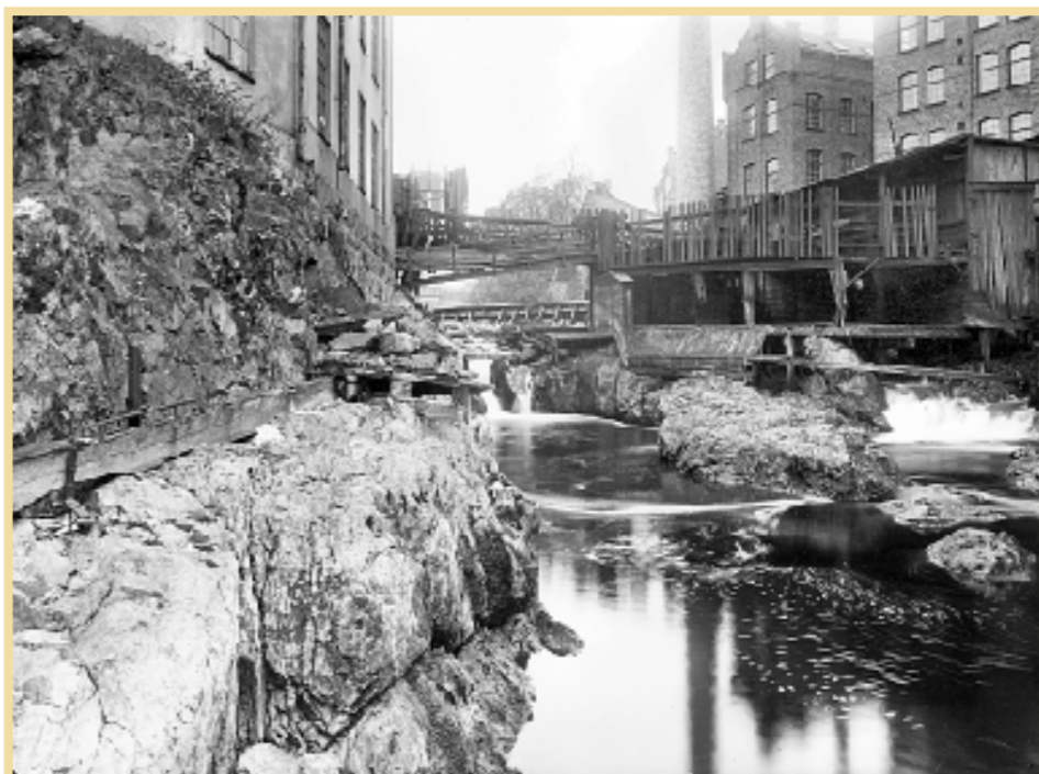
Regleringen innebar även att de så kallade Laxholmsfallen, mellan Laxholmen och Smedjeholmen, försvann.