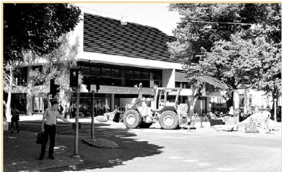
Samma hörn idag. Men Villa Flora är sedan 1971 ersatt med Stadsbibliotekets grå betongkoloss.

D agens Stolta Stad har gjort ett nedslag, då och nu, vid ett välkänt hörn i innerstan. Ett hörn, som under åtskilliga decennier inrymde en av stadens vackraste byggnader. Det är även dags för den sista tävlingsomgången för den här säsongen.