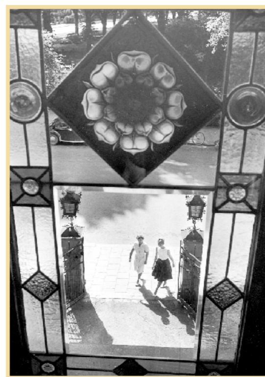
Arkivbild, foto: INGVAR ANEHED

1962 byggdes Villa Flora om och förvandlades till statens sjuksköterskeskola. Lägga märke till det pampiga och detaljrika fönstret.