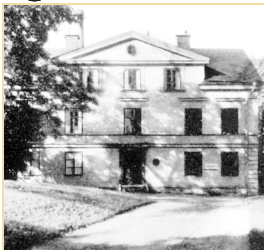
Gryts herrgård på en bild från sent 1940-tal. Både Under Söderberg & Arosenius och under Tuppens fungerade byggnaden som bostad för disponenter och förmän.

Man hade bland annat köpt in en "mekanisk spinneriinnrättning", vilken hade köpts i England och förts till Norrköping och Smedjeholmen av lagmannen John Swartz