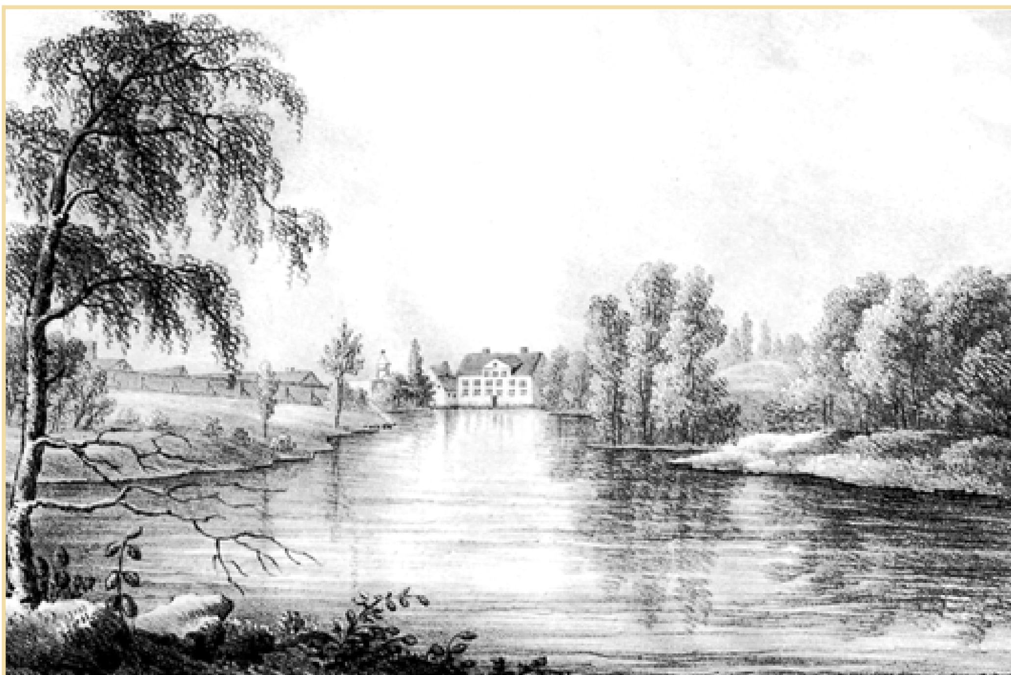
Gryts herrgård, omgiven av lummig grönska, på en idyllisk bild från 1800-talets första hälft. Bilden ur Stiftelsen Gammalt Hantverks samlingar vid Stadsarkivet.