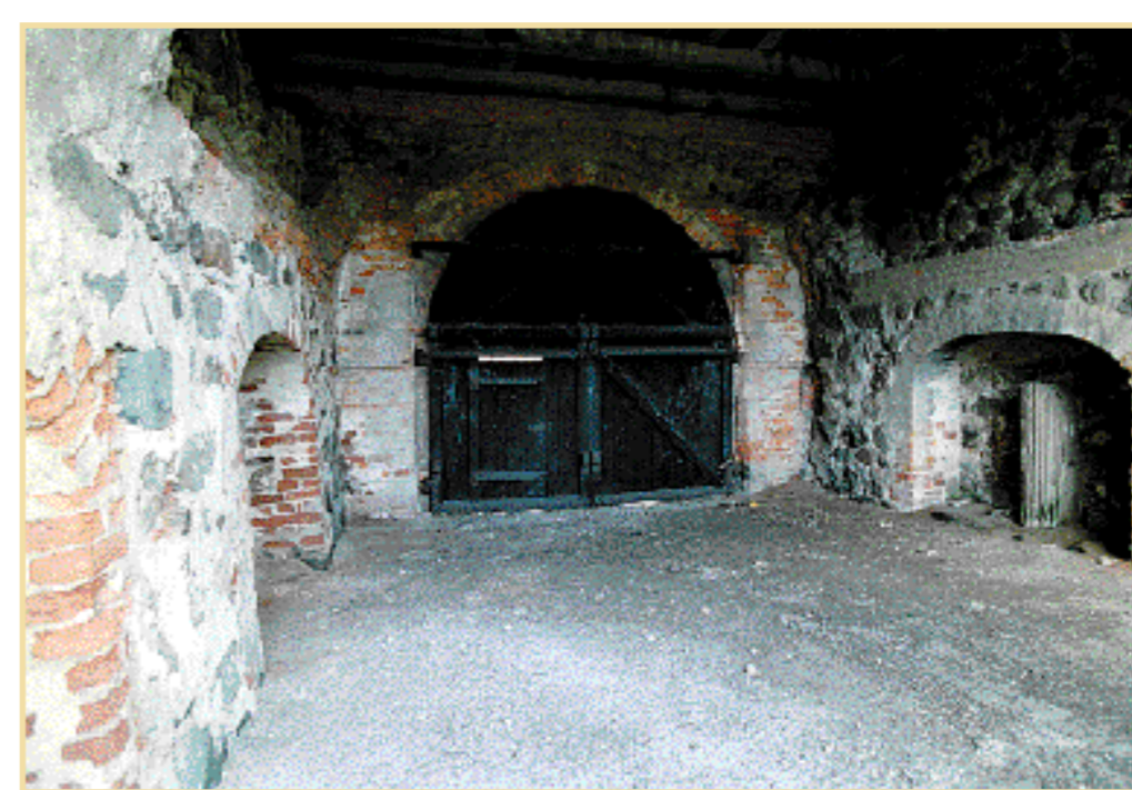
En titt in vid baksidan av porttornet. Under årens lopp har det forna slottsområdet utsatts för mänsklig påverkan. Därför sitter där nu ett stort galler.