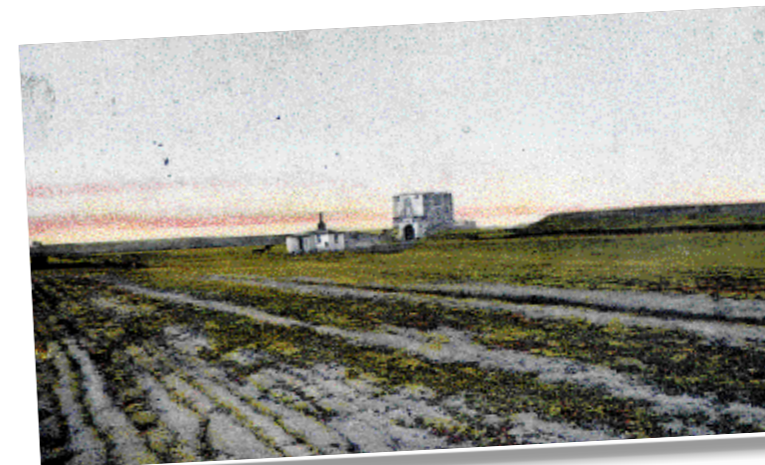
Johanneshovs slottsruin på ett kolorerat vykort i början av 1900-talet. Själva slottet var sedan länge jämnt med marken och området användes då som åkermark. Senare skulle delar av den gamla slottsvallen försvinna när SJ byggde nya lokstallar.