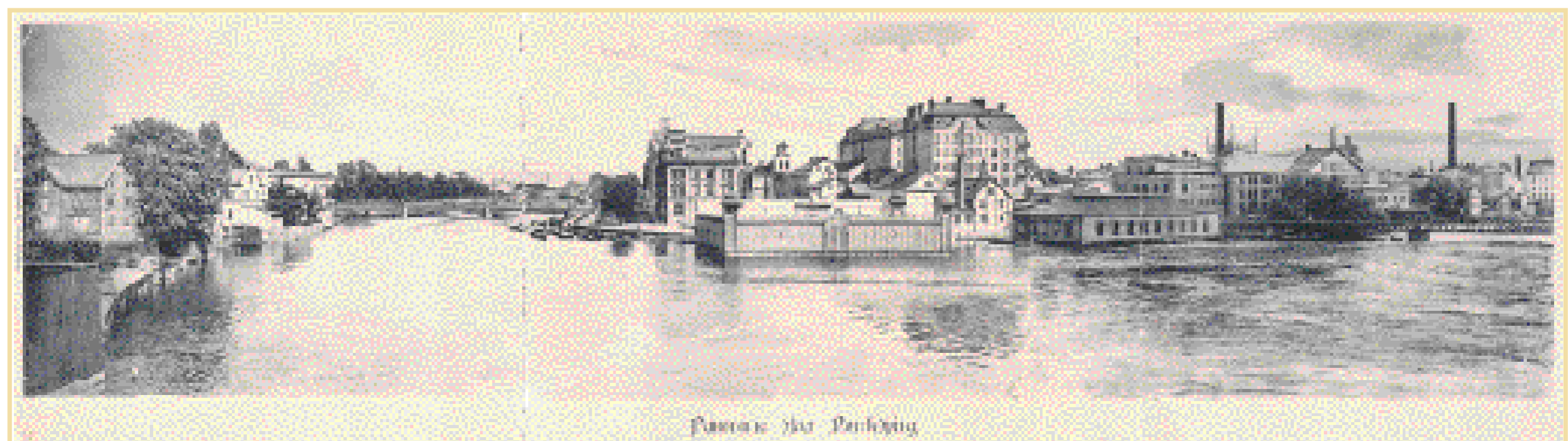
Ett storslaget panorama. Stadsbilden vid Strömkröken i början på 1900-talet. I mitten ses kallbadhuset vid Refvens grund, därefter Klapphuset och Spängen. Bakom Klapphuset ses gamla varmbadhuset. Till vänster ses bebyggelsen i kvarteret Enväldet och Oscar Fredriks bro.