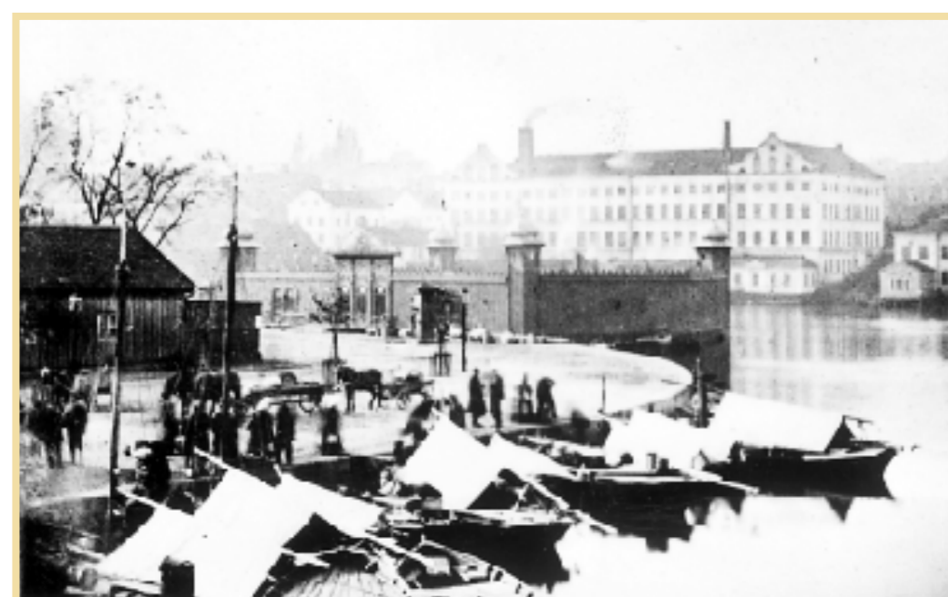
Två badhus. I förgrunden Fiskhamnen och sedan kallbadhuset vid Refvens grund. På andra sidan ses Tuppens fabrik vid Garvaregatan. Den lilla byggnaden till höger är det tidigare Nya Badhuset, uppfört på 1840-talet. Bilden ur Stadsarkivets samlingar.