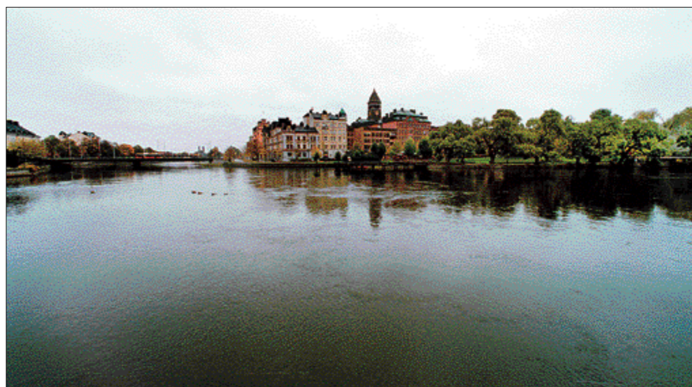
Ungefär samma panorama som ovan idag. Åtskilligt har hänt under årens lopp. Staden fick ett nytt rådhus 1910, Spängen kapades och runt den fylldes schaktmassor från byggnationen av kraftstationen Bergsbron-Havet. Vilket innebar att en ny park, Strömparken, skapades. Borta är även gamla badhuset och simhallen.