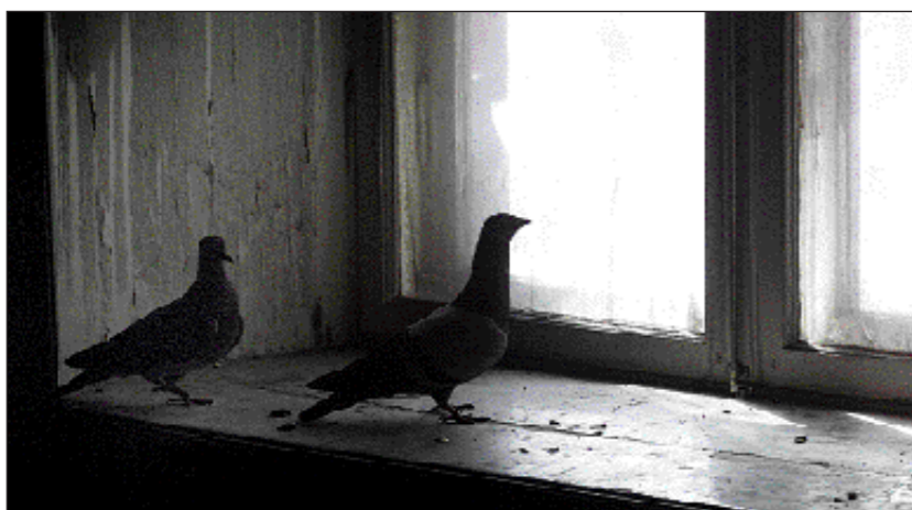
Ett rum med utsikt. Duvor och rättor har under åren haft silobyggnaden som hemvist. Men efter en omfattande sanering är rättorna borta. Dock inte det sista duvparet.