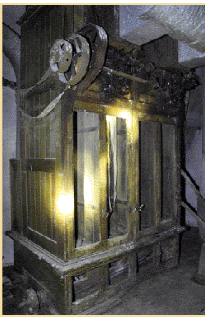
Gediget hantverk. Själva silodelen består av ett par våningar. Här en välbevarad del av transportsystemet.