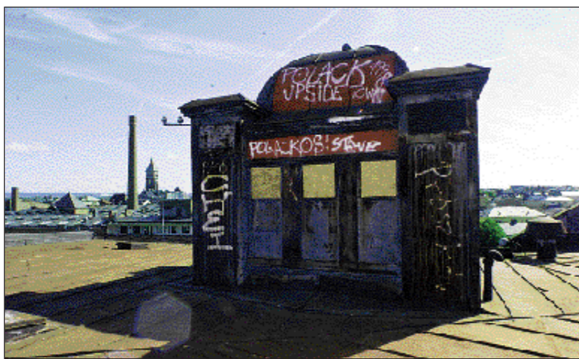
Klotter på hög nivå. Inte ens silobyggnadens lilla torn har fått vara i fred under åren som gått.