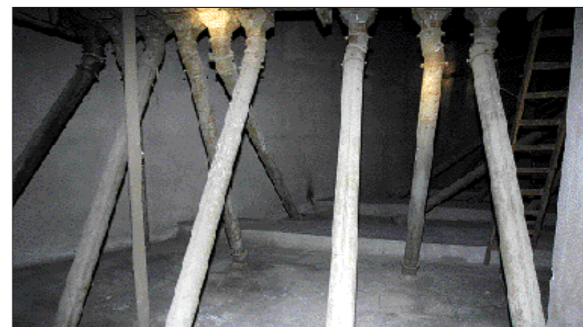
Raka rör. Verksamheten vid Ståhlboms silo var uppbyggd kring det sinnrika systemet med transportbanor och schakt för brödsädet. På bilden några av de rörsystem som användes.