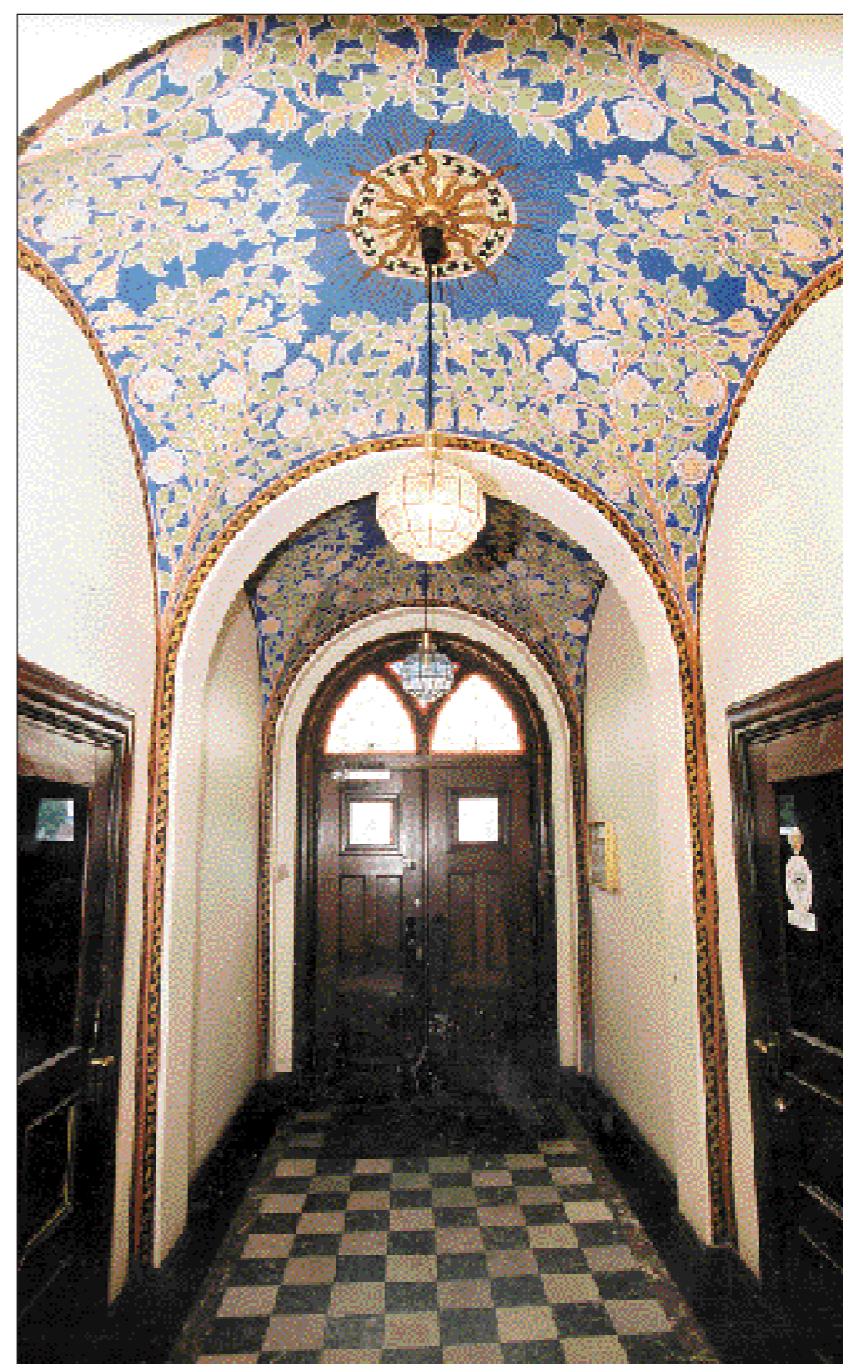
Trapphallen vid de Ringborgska huset på Fleminggatan. En upplevelse med valv målade i böljande växtslingor.