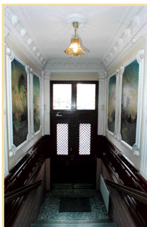
Skolgatan 24, med 1893 som byggår. Även här en trapphall med väggmålningar och stuckatur.

Freskerna visar allegoriska motiv i antiken. Över porten återfinns ett herdelandskap och allt är inramat av guldfärgad stuckatur och marmorerat trä.