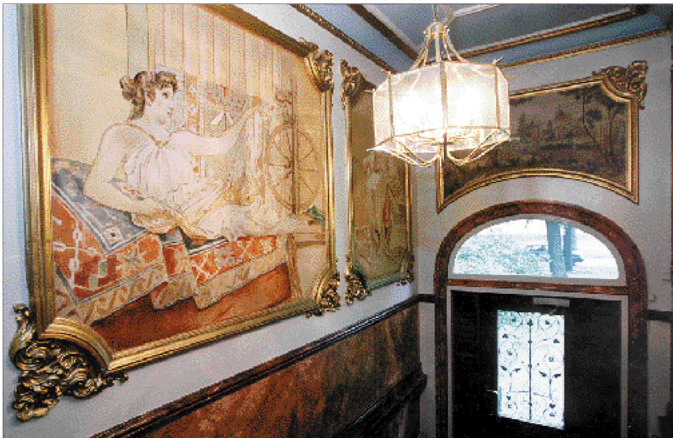
Bevarad, renoverad och välvärdad. Trapphallen vid Östra Promenaden 48 är ett fint exempel på ett hus från förra sekelskiftet, med en konstnärlig utsmyckning i entrén.