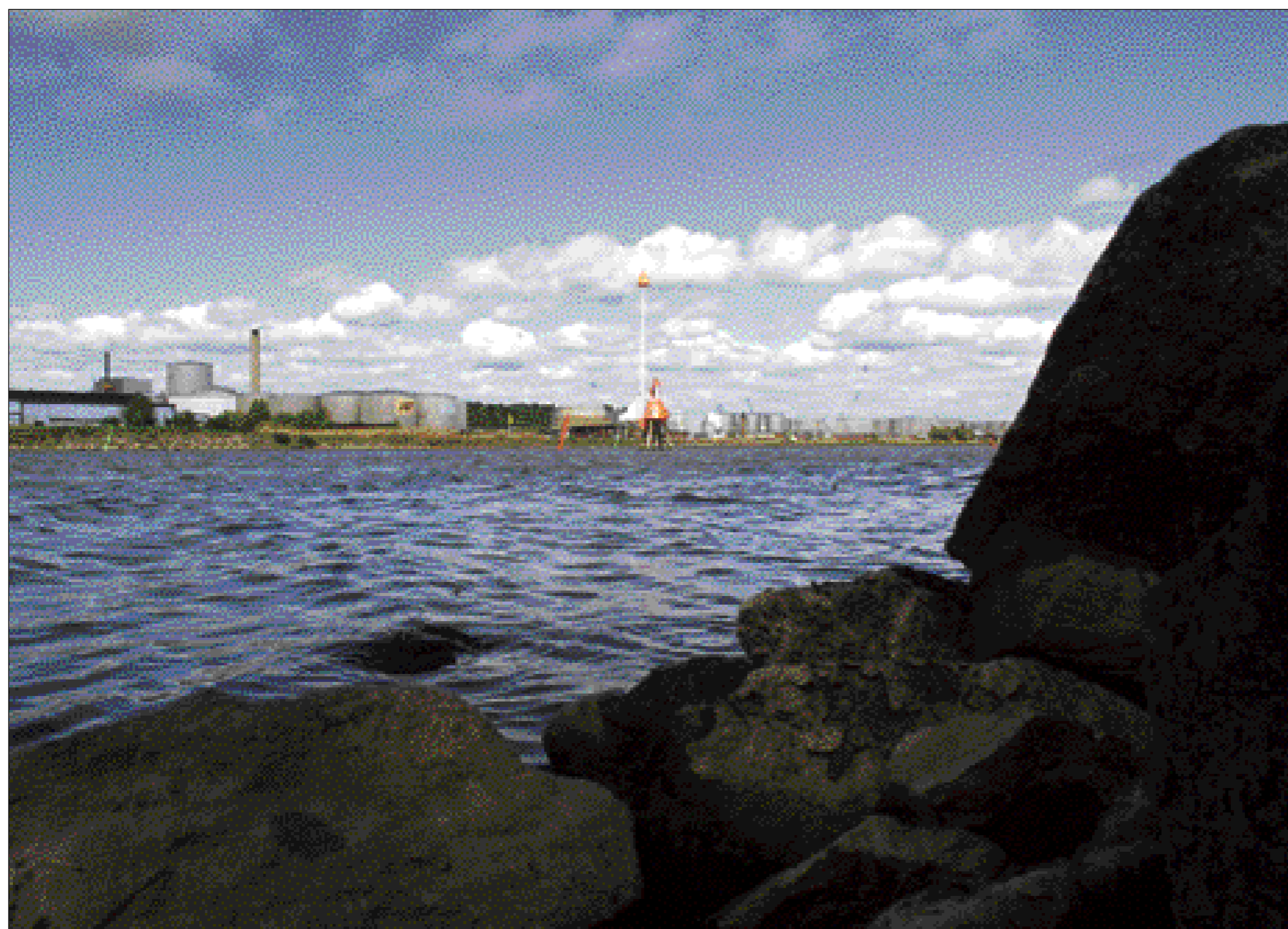
Lindökanalen år 2002. På grund av de stora uthamnarna har den idag till viss del spelat ut sin roll.