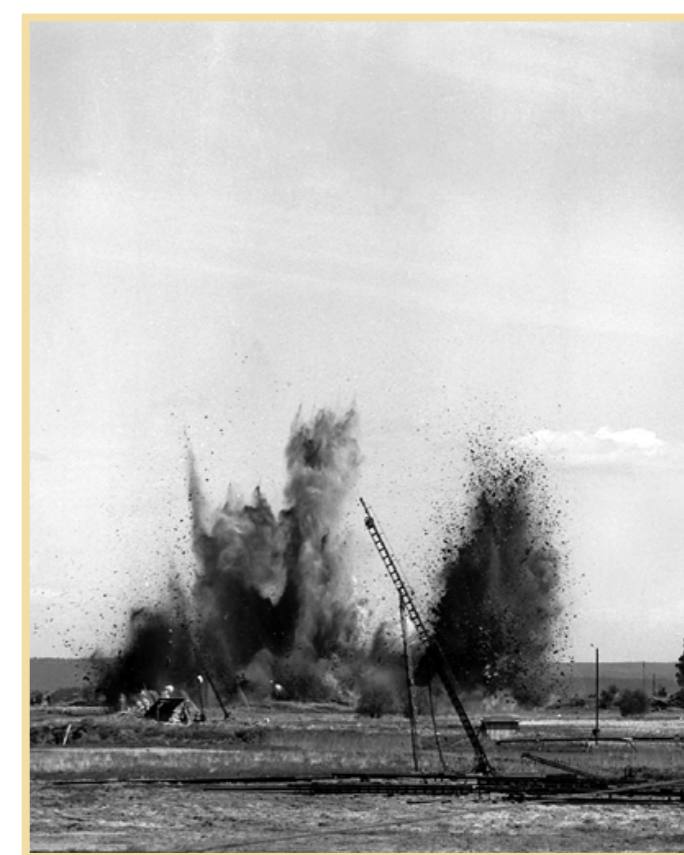
ARKIVBILD Onsdagen den 20 maj 1959. En världsrekordsmäll har just detonerat. För denna gick det åt 56 ton dynamit, fördelat på 12 500 kapslar och 4 750 borrhål. Något liknande hade världen aldrig skadat förut.