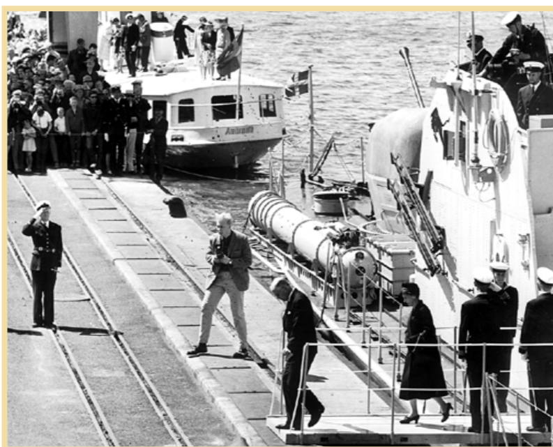
ARKIVBILD Kung Gustaf VI Adolf och drottning Louise går iland vid Öhmansskajen. I själva invigningsprogrammet ingick även en kunglig kortge genom staden och en kungalunch i Folkborgen.