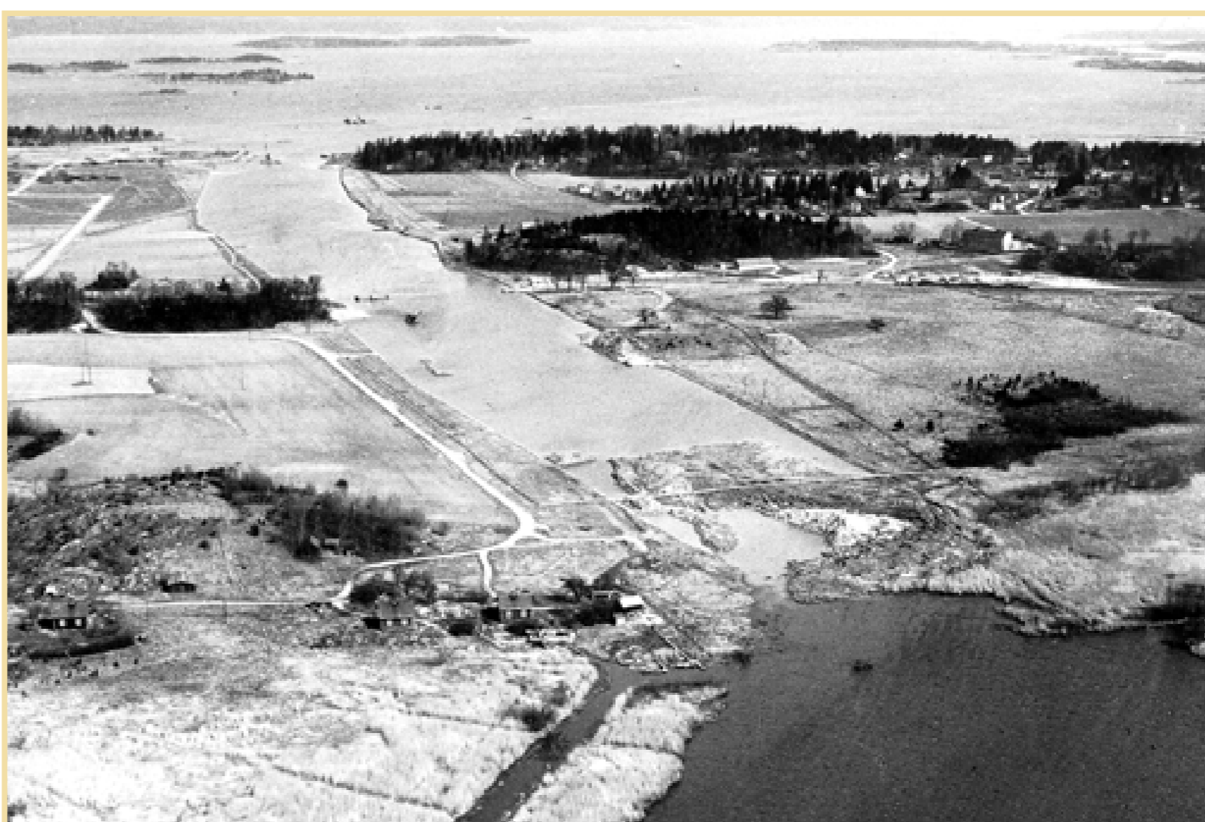
ARKIVBILD April 1961. Lindökanalen är i det närmaste fullbordad. Vad som återstår är en liten landdrens. Till höger ses Lindö och på andra sidan kanalen anlades senare Pampusshamnen.