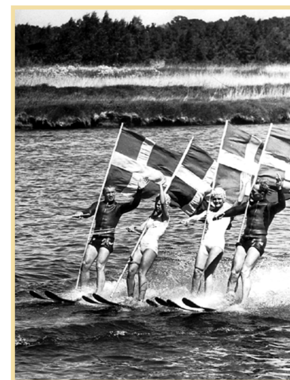
ARKIVBILD Många åskådare hade troligen kommit för att se den vattenshow som folkhjärten Sven Tumba Johansson & Co genomförde på kanalens vatten timmarna innan själva invigningsceremonien.