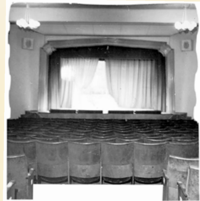
Samma scen premiärdagen. Ensemblen fick hänga upp skyngen längs väggarna för att inte publiken skulle få målarfärg och murbruk på kläderna.