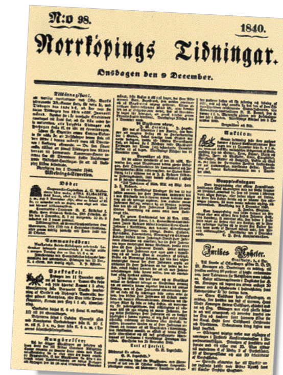
År 1840 infördes ett större format på tre spalter. Texten på första sidan började med kungörelser och annonser. Först längst ned till höger kom Inrikes Nyheter.