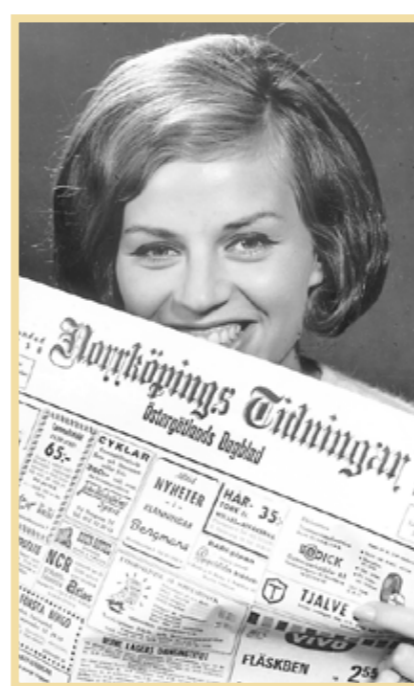
Fram till 1970 hade förstasidan varit förbehållen annonser. Men den 2 januari samma år förvandlades densamma till nyhetssida.