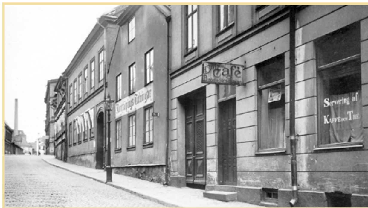
Tidningshuset på Västgötegatan (i mitten). Här återfanns Norrköpings Tidningar med egen gård och tryckeri från 1787 till 1918.

Ytterligare ett steg in i modern tid togs när