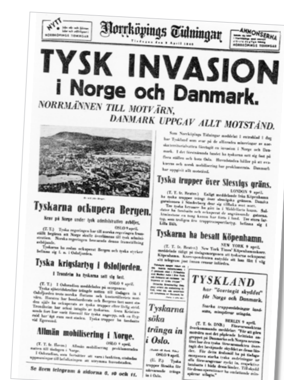
Braskande rubriker från den 9 april 1940. Tyskland hade invaderat Norge och Danmark, vilket givetvis dominerade på nyhetssidorna.