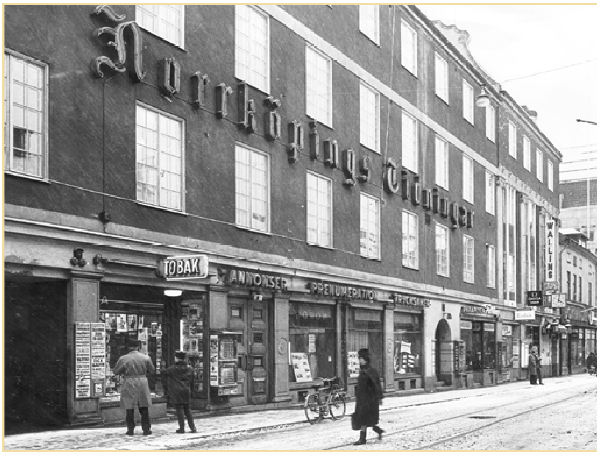
Tidningshuset på Hospitalsgatan, där NT återfanns från 1918 fram till 1970, då flytten gick ut till Stohagsgatan.