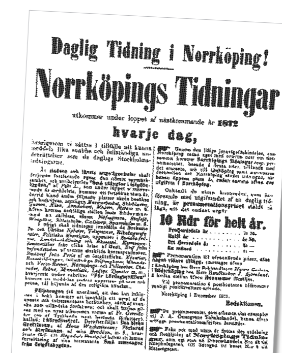
En annons från december 1871. Den basunerar ut att Norrköpings Tidningar från och med årsskiftet skulle komma ut sex dagar i veckan.