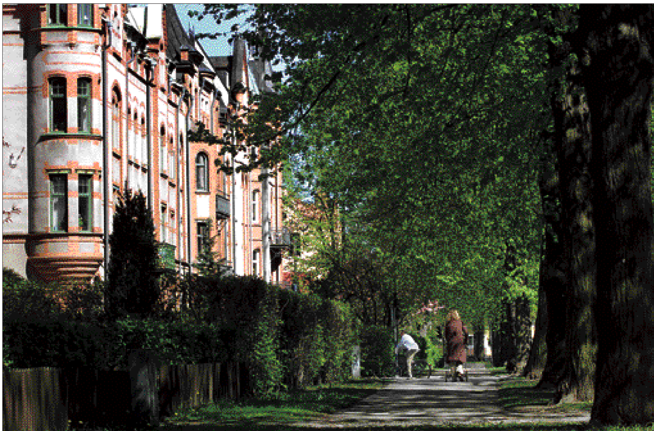
Det är nu man ska ut och promenera i Promenaderna. Det är nu som lindarna visar upp den första skira grönskan.