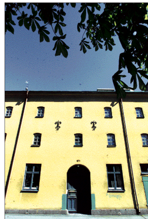
Orangerigatan är lika med platsen för det forna sockerbruket Planeten och dess förrinnan ett spinnhus. De byggnader som ersatte sockerbruket fyller väl sin plats.