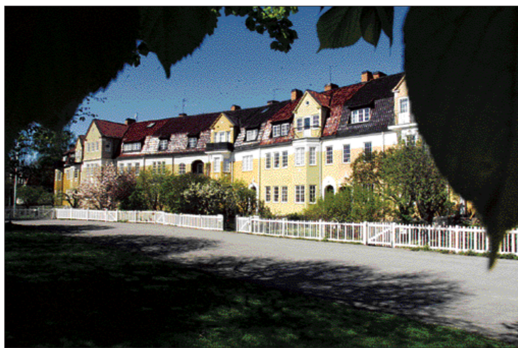
Den blomstertid nu kommer. De engelska radhusen vid Södra Promenaden börjar nu att visa upp en prunkande växtlighet.