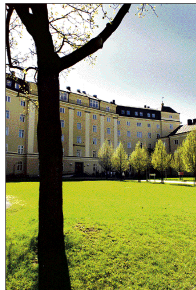
Fjorton år har passerat sedan sista natten med gänget. Det var i januari 1988 som hela huvudkomplexet på gamla Centralasarettet förvandlades till fest- och avskedslokaler.