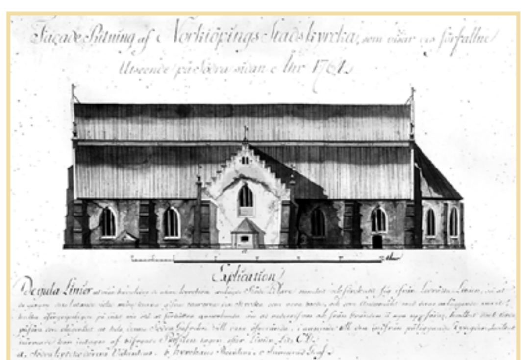
Gamla S:t Olai på en bild från 1764. Fyra år senare kunde arkitekten Cronstedts nya kyrkobygge invigas.

Drygt 50 år senare var det dags igen. Men då tillbaka till ruta ett.