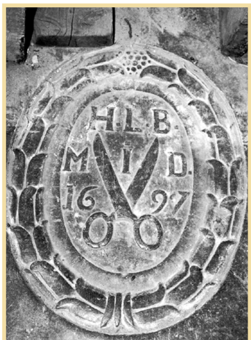
En rest från 1660-talets kyrka. Vid en renovering för fyra år sedan upptäcktes rester från den medeltida kyrkan. Och ovan detta lager återfanns delar av golvet från 1660-talet.