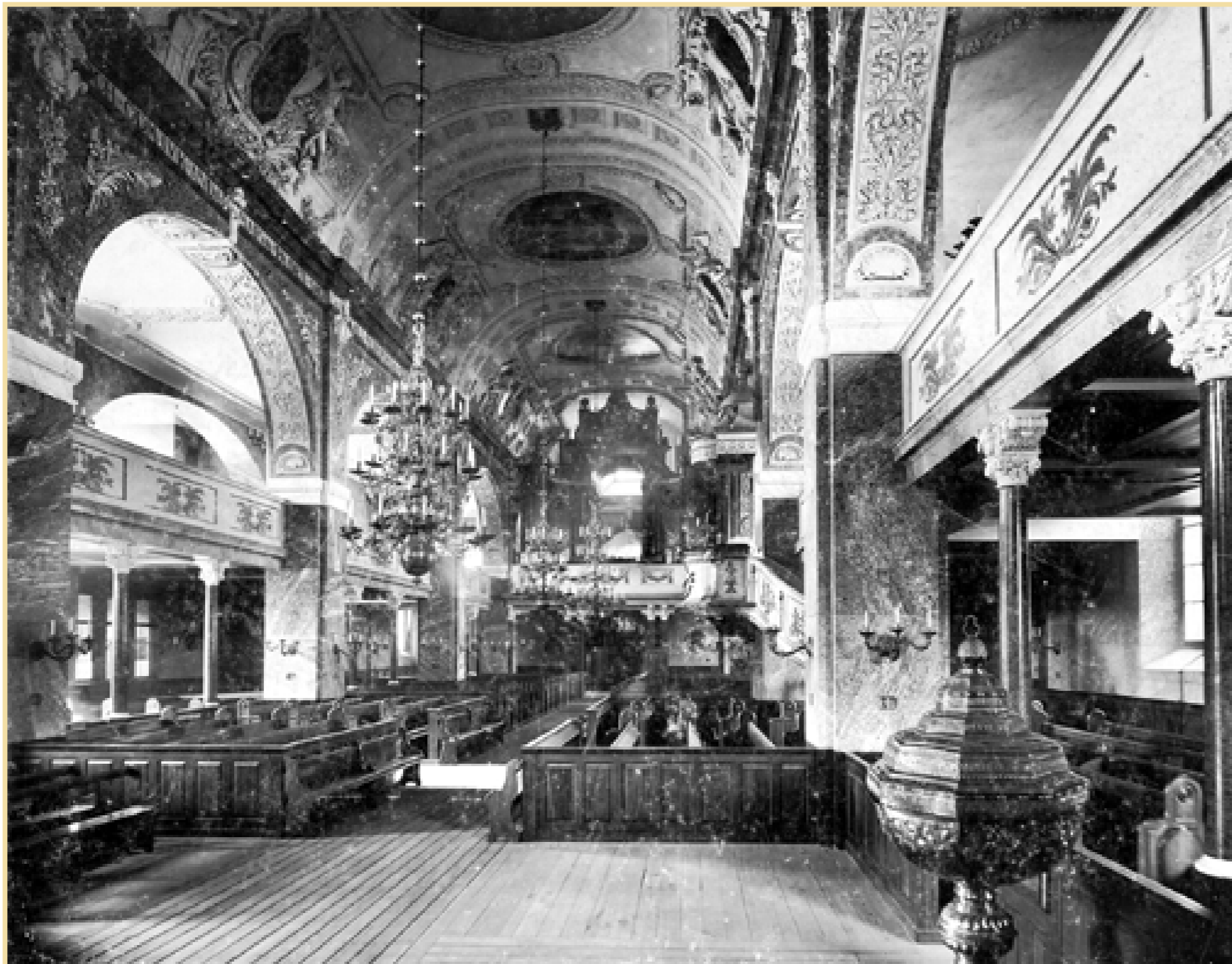
Interiören av 1890-talets kyrka, på en bild från 1901. Lägg märke till den svulstiga och pompösa barockdekoren, signerat slottsarkitekten Agi Lindegren, samt överflödet av målningar. De äldre bilderna från Norrköpingsrummet vid Stadsbiblioteket.