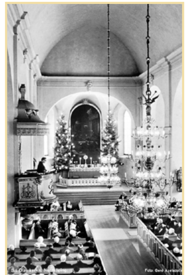
Efter renoveringen på 1940-talet återfick S:t Olai 1700-talskyrkans rena och enkla interiör. Bilden från 1961. I predikstolen biskop Ragnar Askmark.