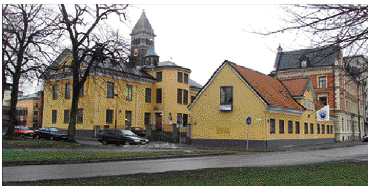
Stadens tredje och fjärde lasarett återfinns i de här byggnaderna i kvarteret Varvet, mellan Fleminggatan och Hamngatan. Den mindre byggnaden användes fram till 1831, då byggnaden till vänster stod färdig. När lasarettet på Strömbacken stod färdigt flyttade polisen in i det här kvarteret.