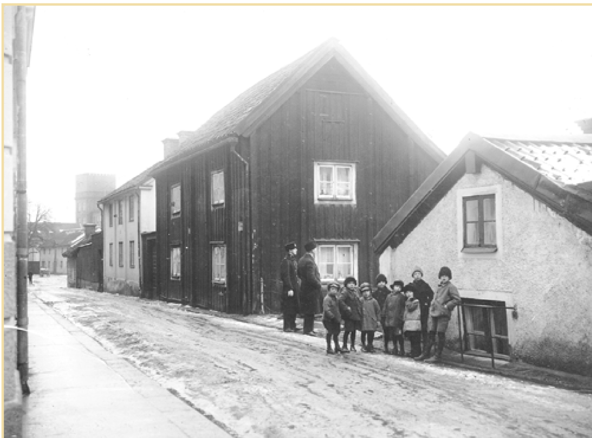
Stadens andra lasarett, vid Dragsgatan i kvarteret Oron på en bild från 1910-talet. Det var i den mörka byggnaden i mitten som staden hyrde in sig i två år i slutet på 1700-talet. Lasarettbyggnaden låg i krönet på backen ovan Strömmen och revs först någon gång på 1930-talet.