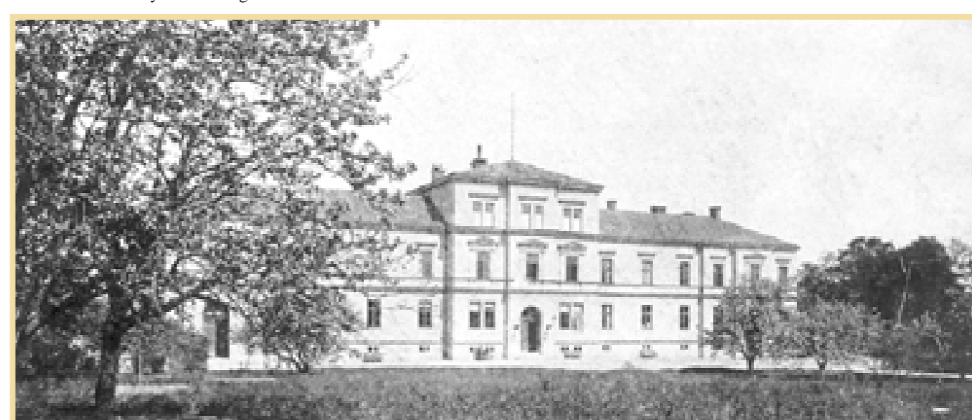
Lasarettet vid Strömbacken, ritat av arkitekten C T Glosemeyer och färdigt att tas i bruk år 1881. Lasarettet ansågs som toppmodern, med 106 platser i lasarettavdelningen och 20 i kuravdelningen.