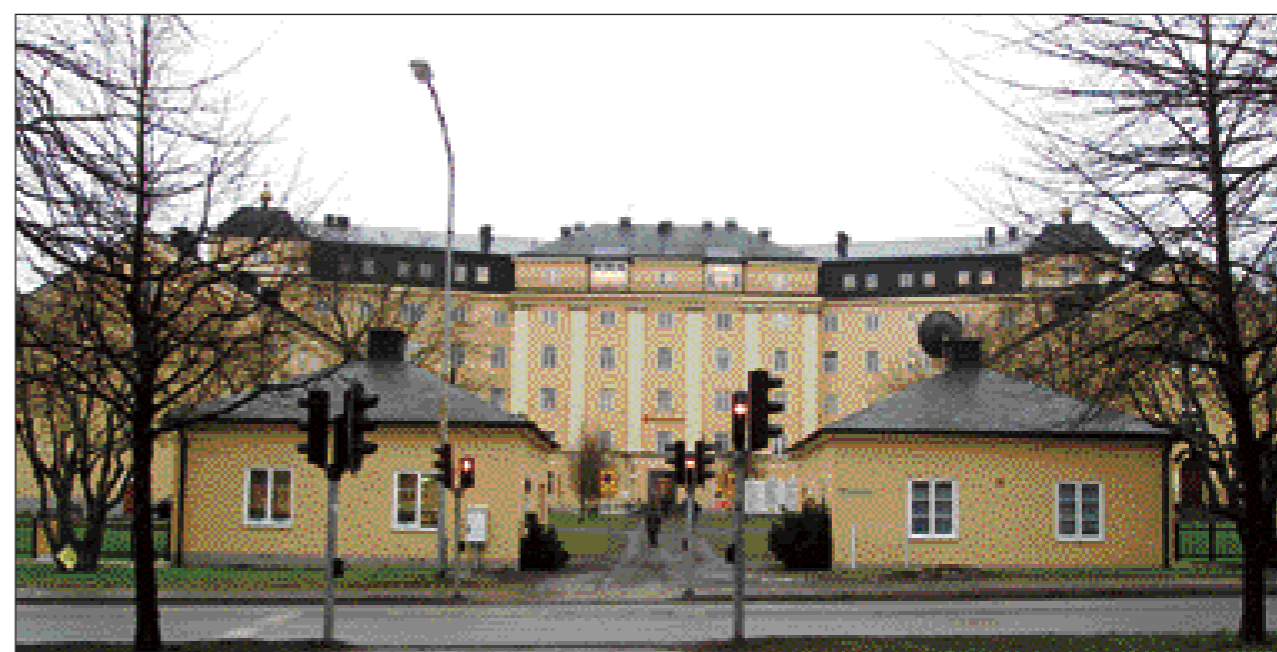
Efter flytten till Vrinnevisjukhuset är Centrallasarettet förvandlat till bostadsområde. I den gamla huvudbyggnaden återfinns bland annat Folkuniversitetet.

Stolta Stad på nätet! Filmer, animationer, läsarminnen, kartor, artiklar, bilder. www.nt.se