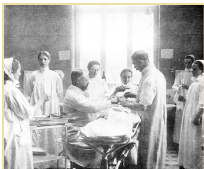
Från operationssalen vid Strömbacken. Från början utfördes operationer i en sjuksal, men efterhand uppfördes en särskild operationsbyggnad. Bilden ur Från Curhus till Länssjukhus.