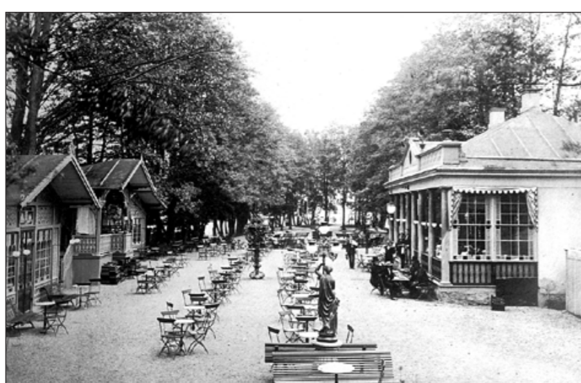
Fran den glada punschepoken. En bild från uteserveringen på Strömsholmen omkring förra sekelskiftet, där herrarna förmodligen avnjuter ett glas i den grönskande idyllen.

” Strömsholmen kom med tiden framför allt att framstå som ett rekreationsområde och som ett nöjescentrum.