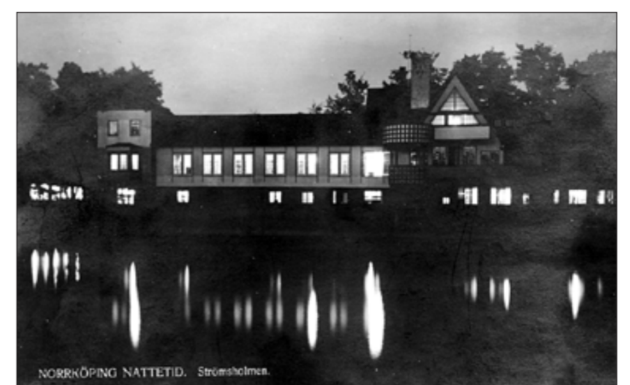
Natt över Strömsholmen. 1906 uppfördes en ny restaurang, ritad av arkitekten Carl Bergsten. Den kom att bli vida omtalad och väldigt populär, inte minst under krögare Dani Liebenfelds ledning. Bilden från Norrköpingsrummet vid Stadsbiblioteket.