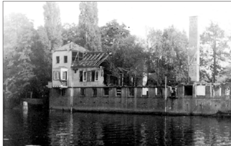
Ett utbränt skal. Restaurangen på Strömsholmen, dagen efter den ödesdigra branden i juni 1939. En stor del återstod dock, men någon återuppbyggnad blev aldrig av.