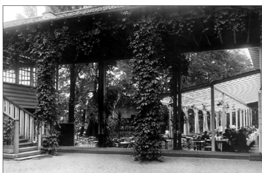
En prunkande oas. En bild från uteserveringen vid 1906 års restaurang. I bakgrunden skimtar den gamla musikpaviljongen. Bilden från Norrköpingsrummet vid Stadsbiblioteket.