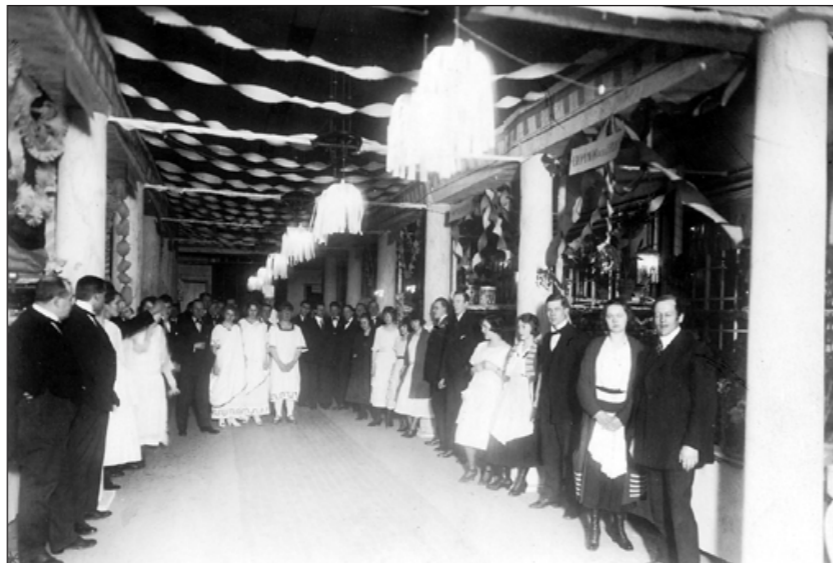
I glada vänners lag. Strömsholmen var en livligt frekventerad festlokal under det tidiga 1900-talet. Bilden är från en bazar med Norrköpings Allmänna Idrottsällskap, Norrköpings Roddklubb och Norrköpings Kappsimmingsklubb 1923.