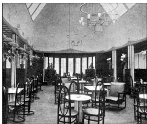
Med känsla och smak. Arkitekten Carl Bergsten ritade även möbler och armatur till 1906 års restaurang. Här ses kaféet med de speciella stolarna. Stolar, vilka idag renderar ett utropspris på minst 50 000 kronor styck på kvalitetsauktionerna.