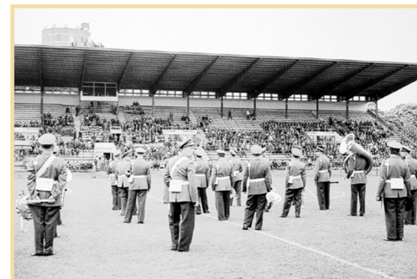
Arbetet med att ställa i ordning den nya VM-läktaren pågick till timmarna innan avspark. Men i och med matchen Frankrike-Paraguay var den officiellt invigd.