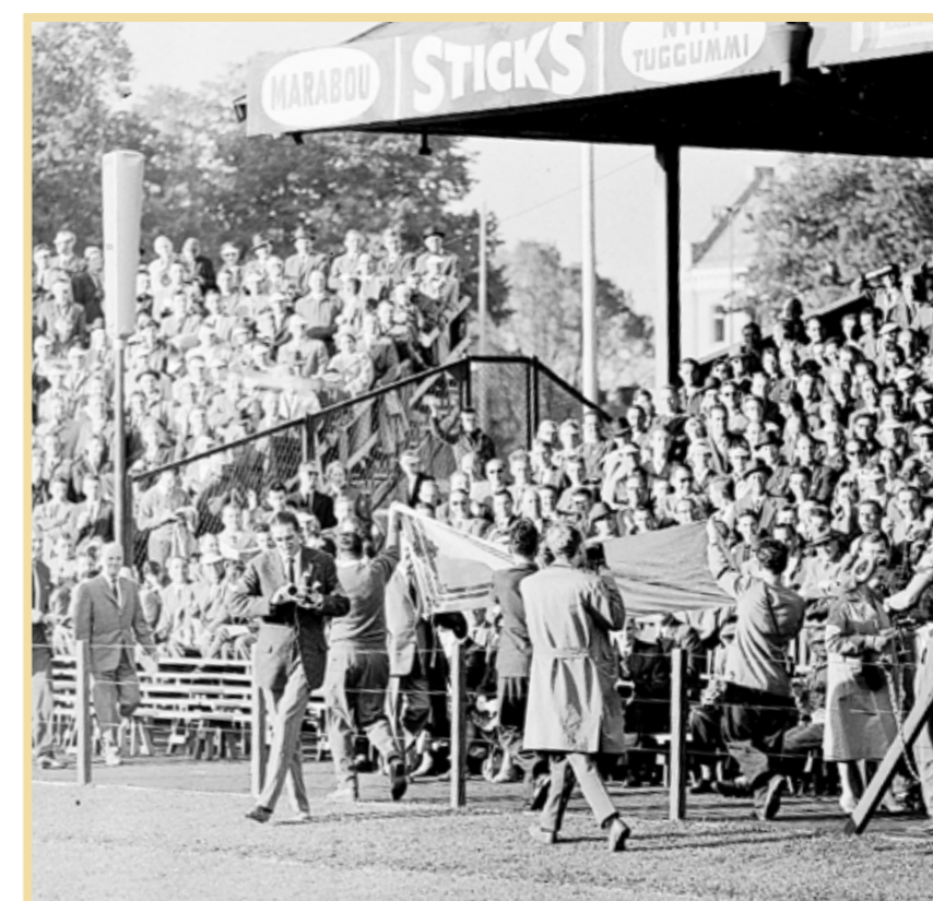
Skotska supportrar försöker elda upp massorna. En syn som vi vant oss vid genom åren.

Kronan lockade med sitt speciella sillbord. Konsumrestaurangen toppade sin matsedel med sjötunga och remouladsås.