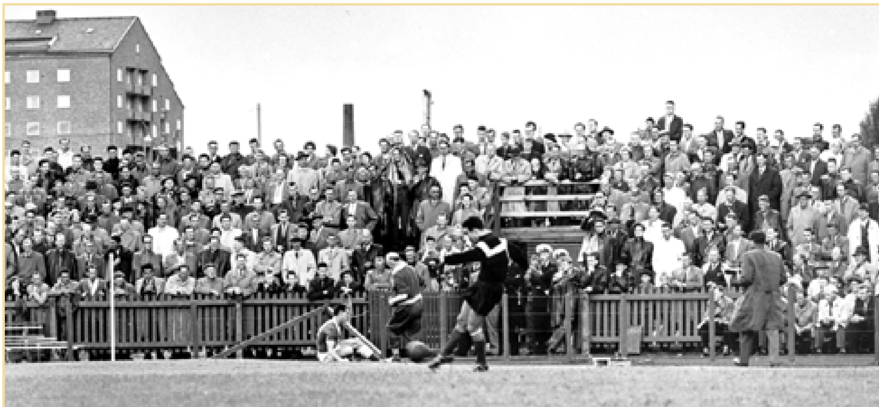
Matchen Frankrike-Paraguay sågs av drygt 16 000 åskådare. De fick bland annat se de franska storstjärnorna Just Fontaine och Raymond Kopa.