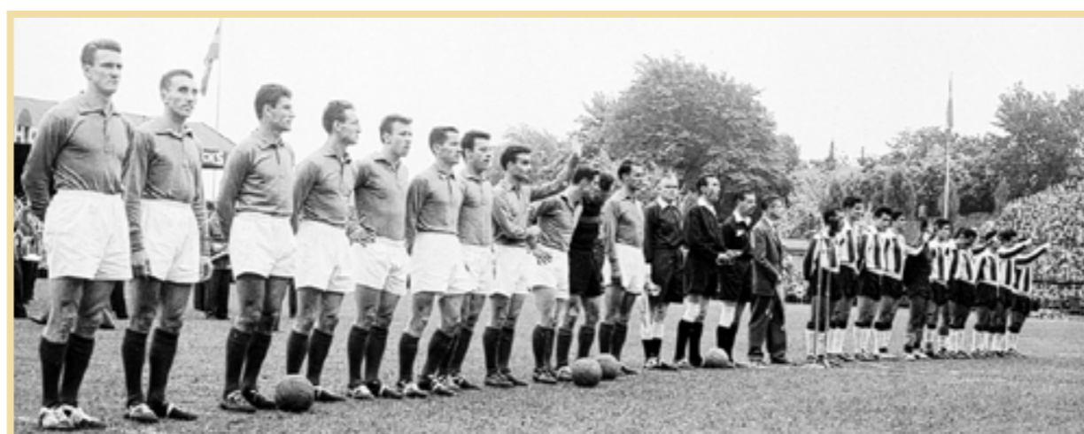
Den första VM-matchen på Idrottsparken stod mellan Frankrike och Paraguay, de senare i randiga tröjor. Frankrike ställde upp med storstjärnor som Fontaine, Kopa och Piantini. Innan avspark var det defilering ute på plan och högtidstal.

Den första VM-matchen i Norrköping spelades