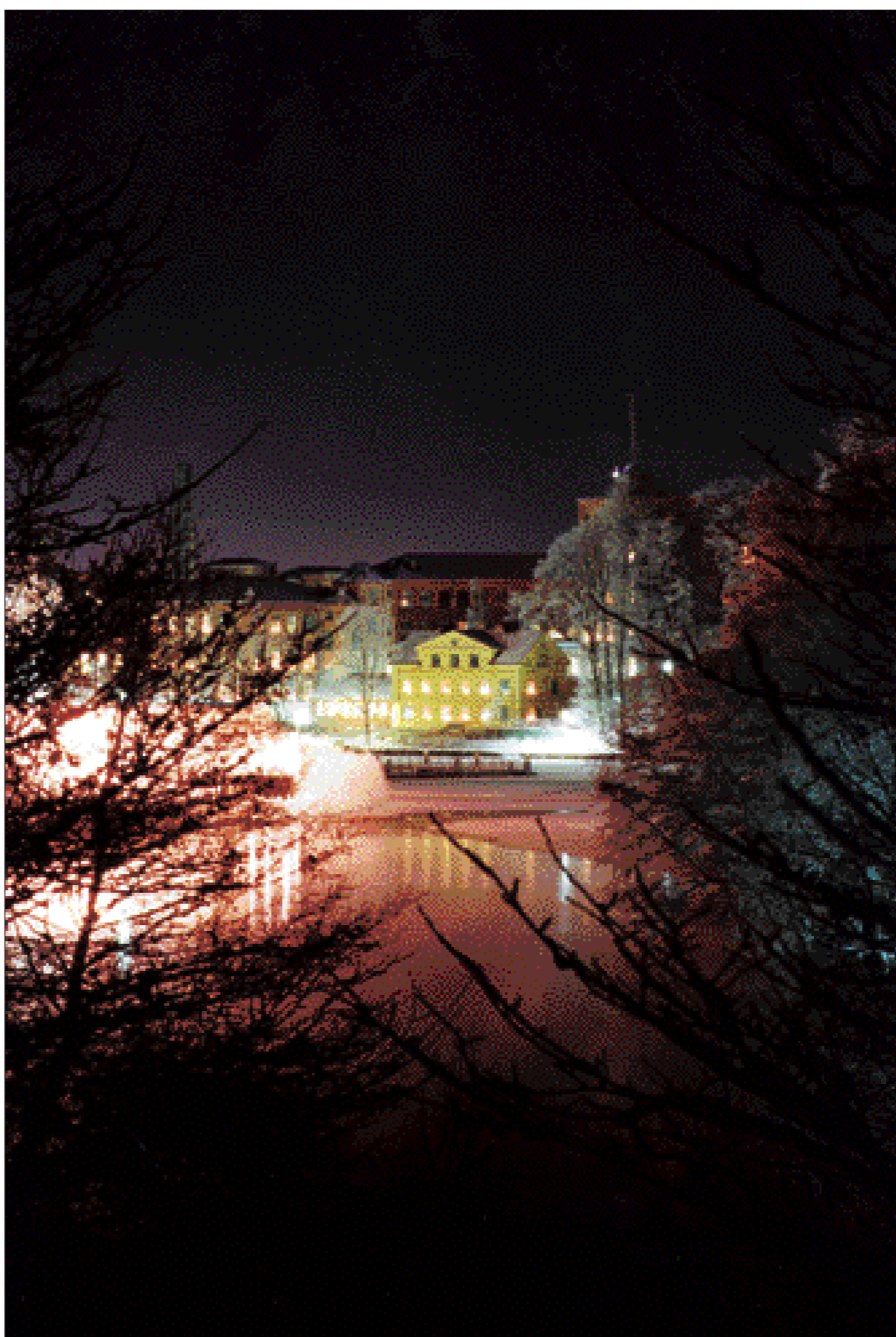
Som ett julkort. Gryts herrgård, sedd från Åbackarna. Under Tuppenepoken fungerade herrgården som förmans- och disponentbostad. I dag är villan privatägd.