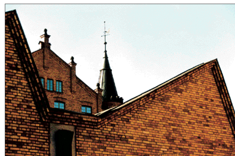
Det engelska inflytandet. Både vid tidigare Tuppens, i bakgrunden, och vid gamla Bergs i förgrunden, kom influenserna i byggandet från England.