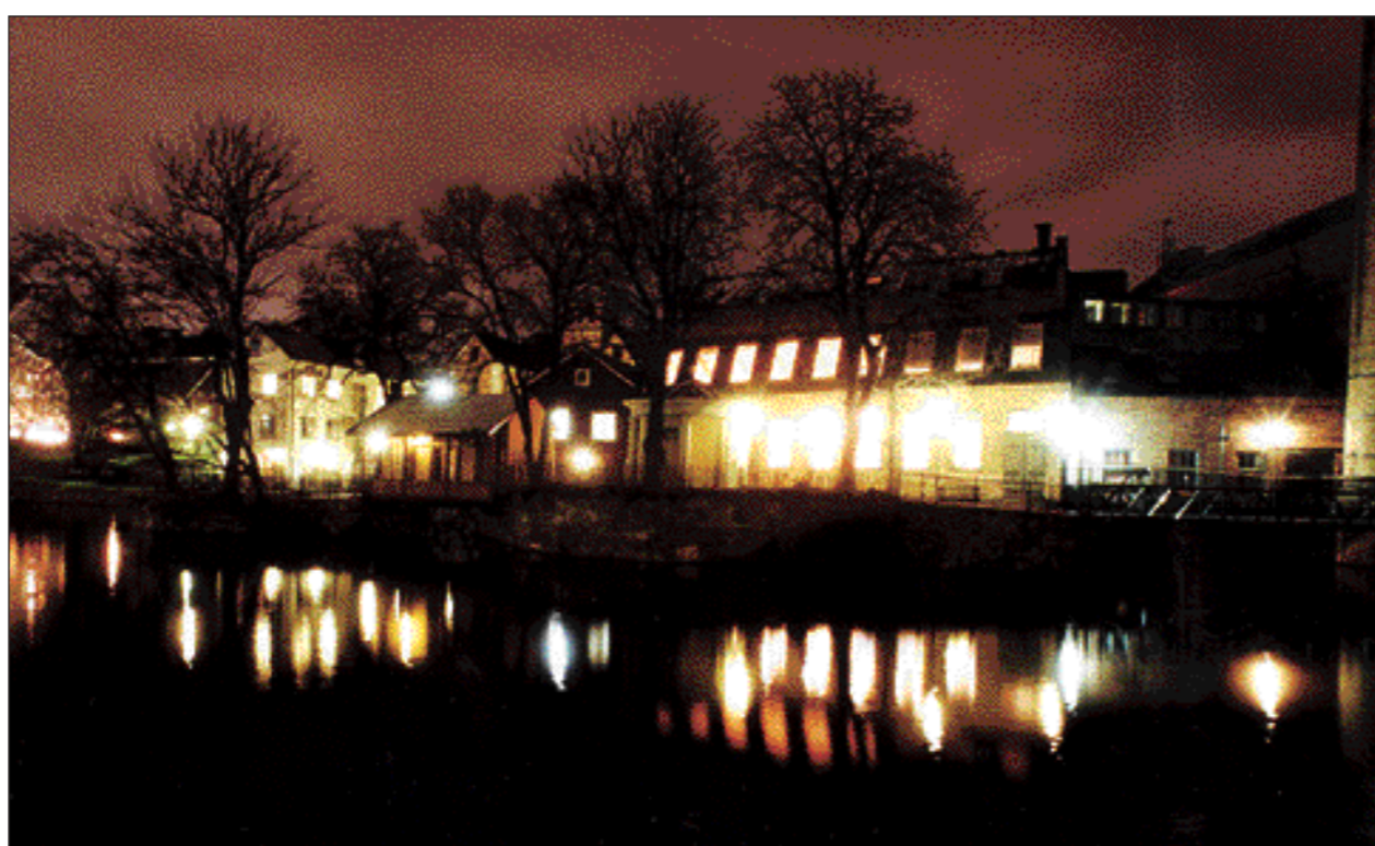
En spännande miljö. Stads museet består av flera olika byggnader, bland annat Bergsbrogården, NIGA och ULTRA.