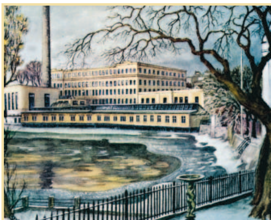
Exteriören av Tuppens fabrik vid Garvaregatan, på en gouache av Carl Palme.

Tuppens, eller Norrköpings Bomullsväveri AB, var flaggskeppet bland staden Norrköpings alla textilföretag.