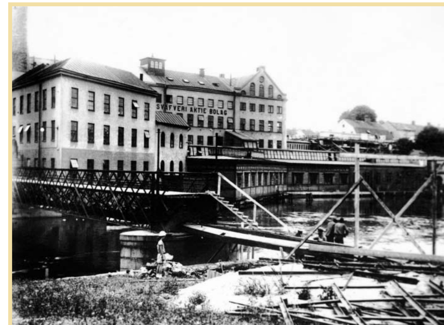
Tuppens fabrik vid Garvaregatan i mitten på 1920-talet. Arbetet med att kapa Spången är i full gång.

LASSE SÖDERGREN lasse.sodergren@nt.se 011-200151