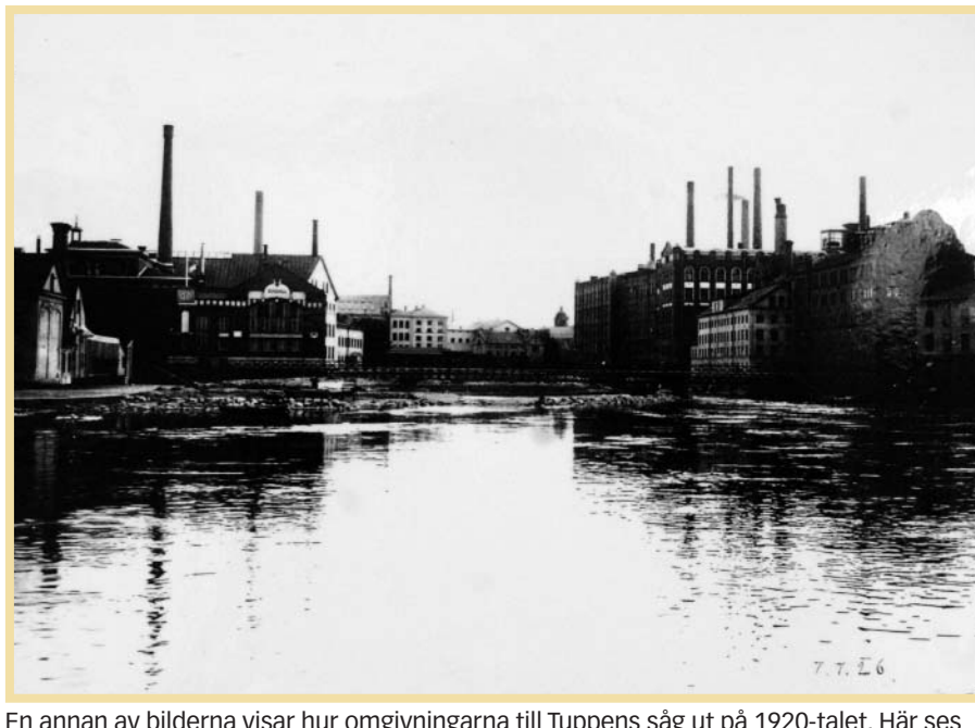
En annan av bilderna visar hur omgivningarna till Tuppens såg ut på 1920-talet. Här ses bland andra textilfabriken Törnell & Ringström och Bryggeriet till höger och varmbadhuset och simhallen på andra sidan Strömmen.