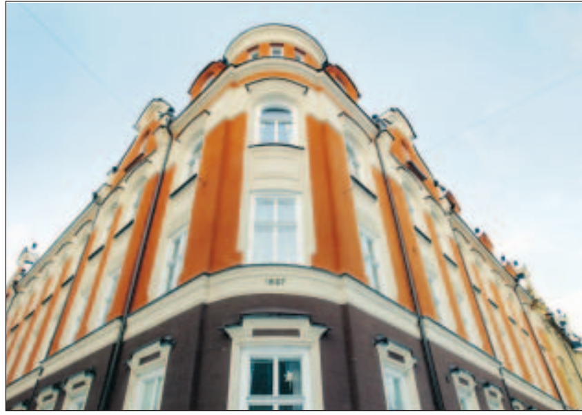
Ringborgska huset, längst ned på Bråddgatan.