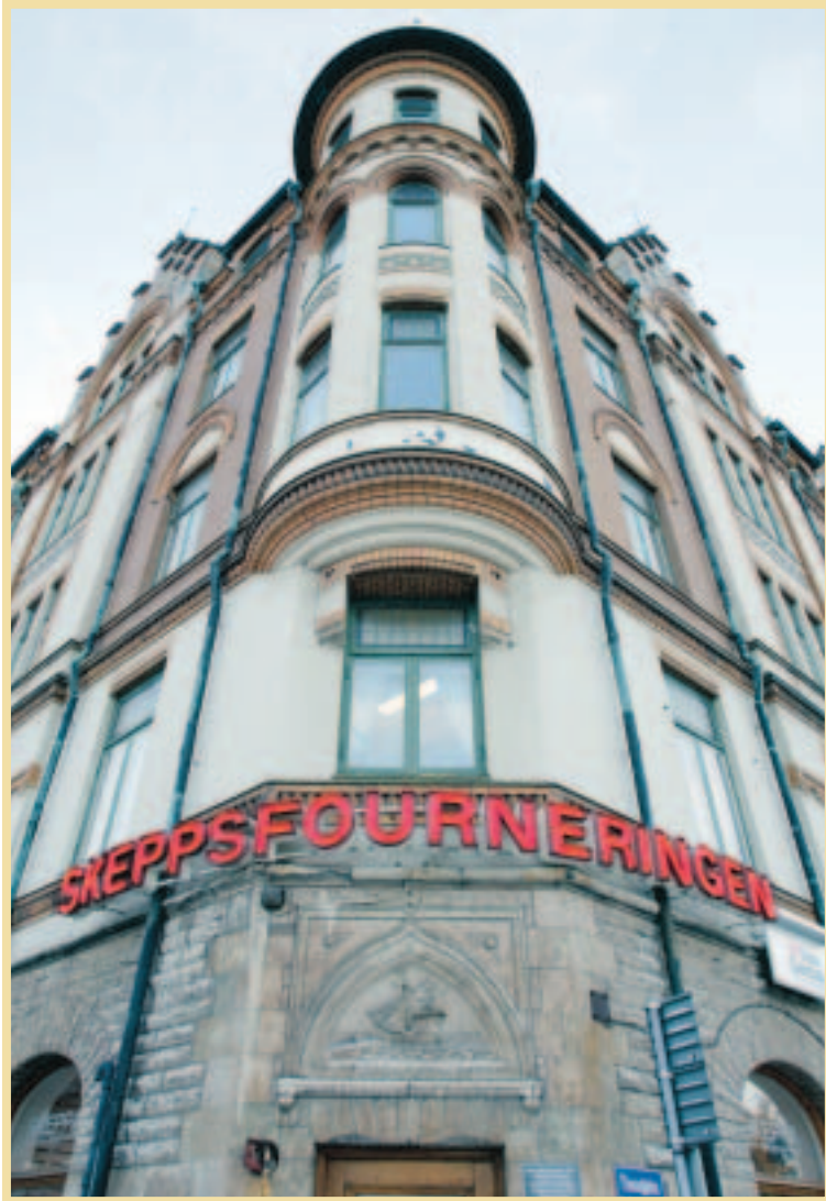
Skeppsfourneringens hus på Fleminggatan.