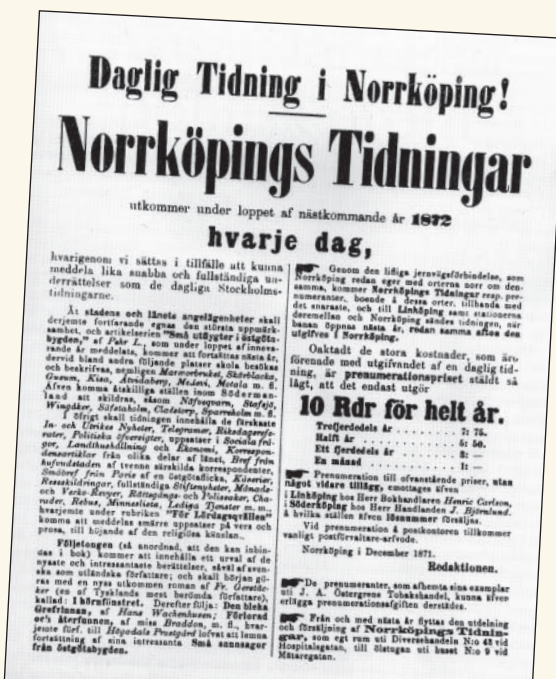
Nyåret 1872. Norrköpings Tidningar kommer ut sex dagar i veckan och med ett större format.