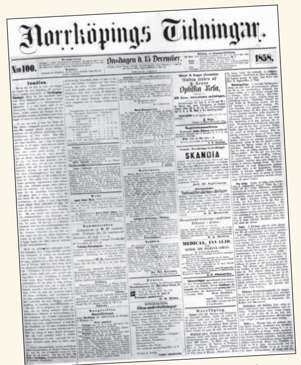
År 1858 införs ett större format på fem spalter. Det var även premiär för ett nytt huvud, fortfarande välbekant för NT:s läsare.