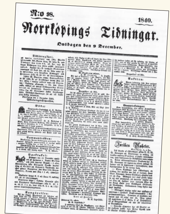
Året är 1840 och första steget mot en modernare tidning är ett faktum. Ny med ett större format på tre spalter.