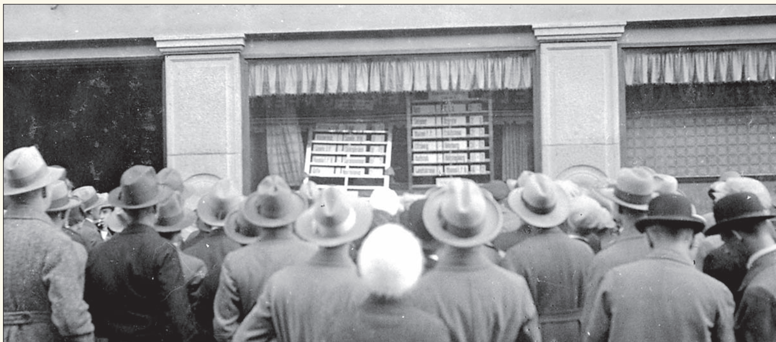
1930. Dagsnyheterna tilldrar sig ett visst intresse utanför tidningshuset på Hospitalsgatan.