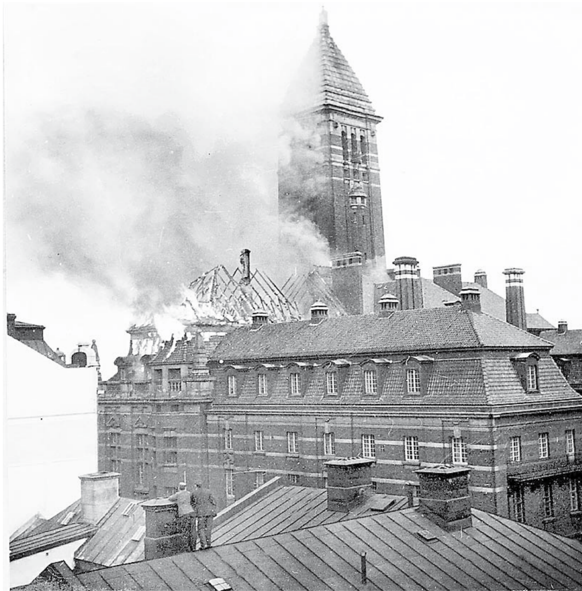
Rådhusbranden 1942, där den västra Rådhusvinden var ett flammande eldhav. Och där Pehr Hörbergs altartavla gick förlorad.