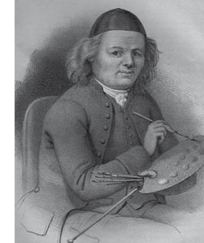
Pehr Hörberg (1746–1816) var en otroligt produktiv konstnär som bland annat målade jättemålningen Davids orkester.