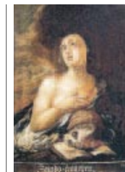
En specialitet hos Pehr Hörberg var bibliska motiv. Här en detalj från en målning kallad Syndaängern.

Kyrkomuseets vänner har vänt sig till konsthistoriker för att få råd hur det ska gå till att göra en kopia. En konstnär i Skåne är nu kontaktad.