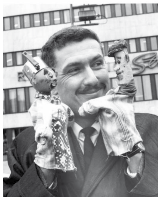
Kasperdockor. Barnprogrammet Jalle, Julle och Hjulius började egentligen som ett program om hur man tillverkade kasperdockor.

”Den första serien var om trädgårdar och trädgårdsskötsel med Sven Green. Det blev också en långkörare.”