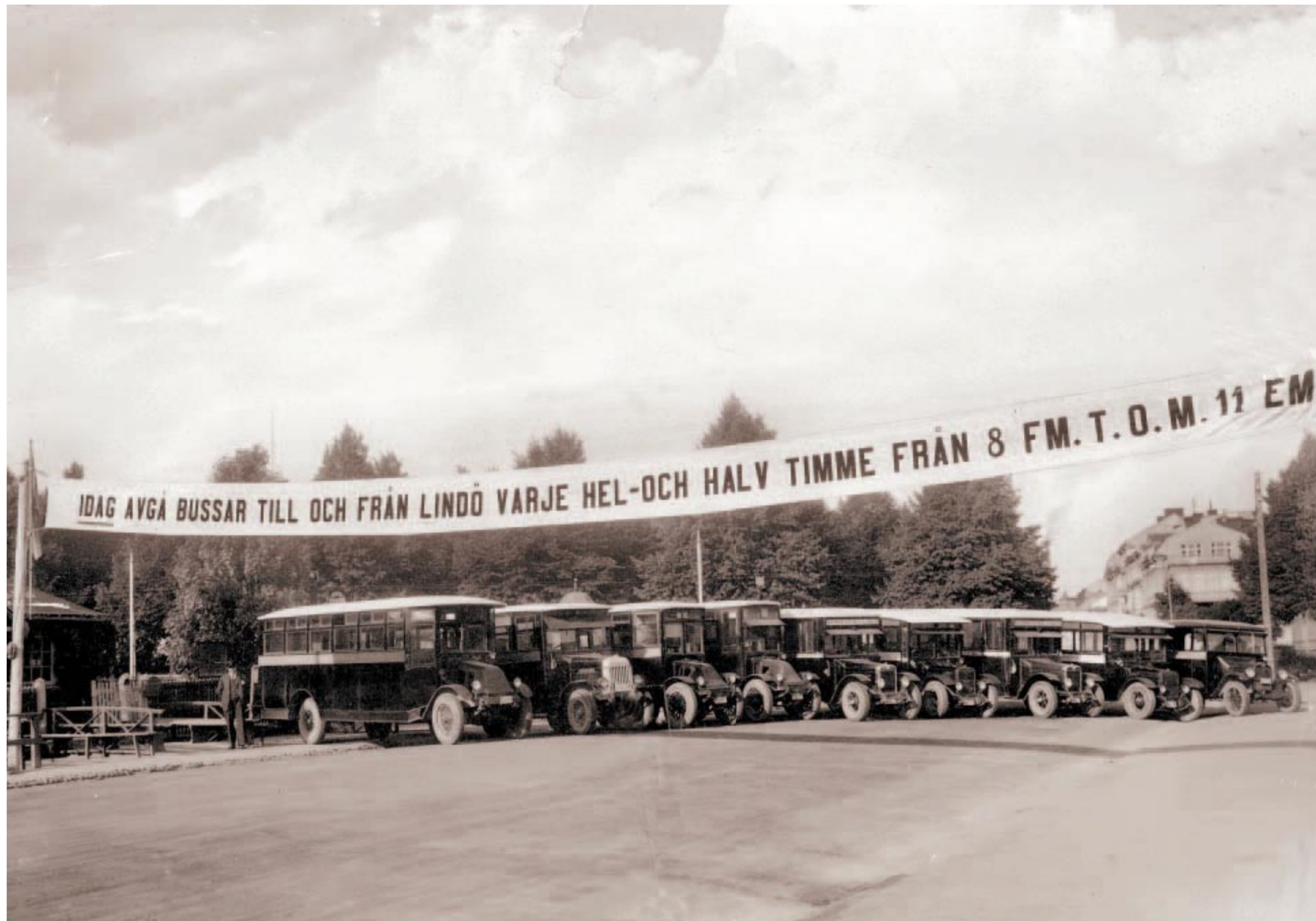
Depån. En bild från hörnet Lindövägen-Östra Promenaden, med bussarna i Lindötrafiken uppställda på rad. Bland annat ett flertal av märket Tidaholm.