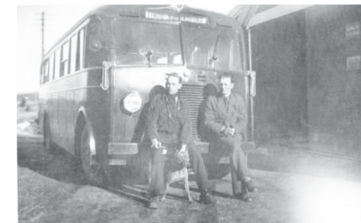
Paus. Efterhand utökades och moderniserades bussarna som trafikerade Lindö.