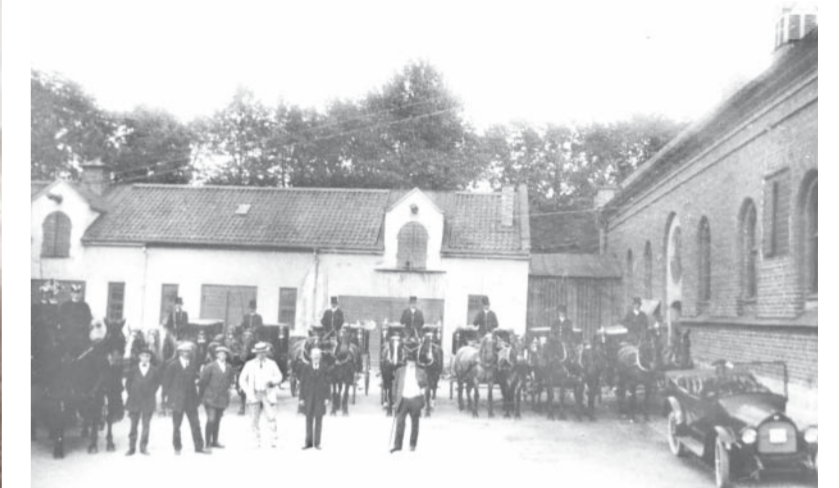
Ursprunget. Lave Lavesson senior i vit kostym på gården till Hyrkuskverket, med personal, hästdroskor och en av bilarna i firman. Bilden är från 1910-talet, brytningstiden mellan häst och bil.