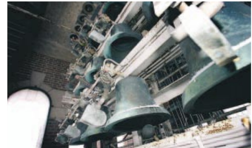
Klockspelet i Rådhuset består av 48 klockor och spänner över fyra och en halv oktav.