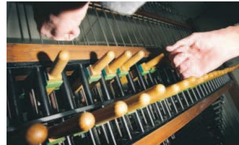
För att få den rätta klangen måste handen formas som till ett karateslag.