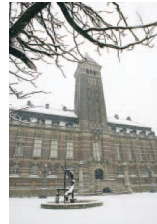
Själva klockspelet återfinns vid de öppna nischer som återfinns högst upp i Rådhuset.